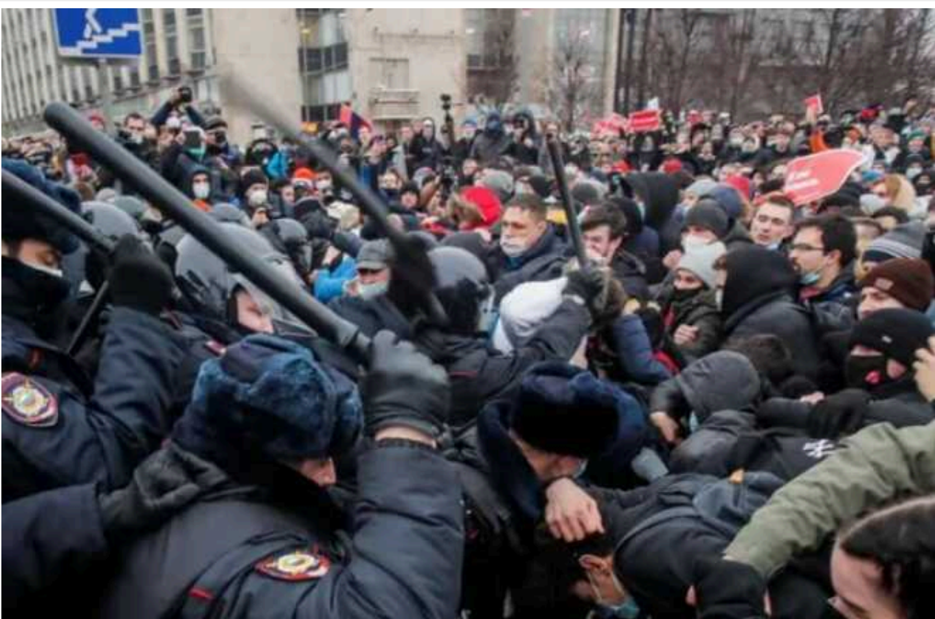
Існує лише одна опозиція російському режиму. І це – Україна

У російській еміграції незавидна доля. Останню чверть століття ці люди погоджувалися на роль зручних спаринг-партнерів для диктатури, яка набирала сили. Займалися придворною благодійністю, боролися за право будувати велодоріжки і пишалися роллю буржуазного фасаду біля концтабору, що будується. Щойно табір добудували – фасад поїхав у еміграцію.