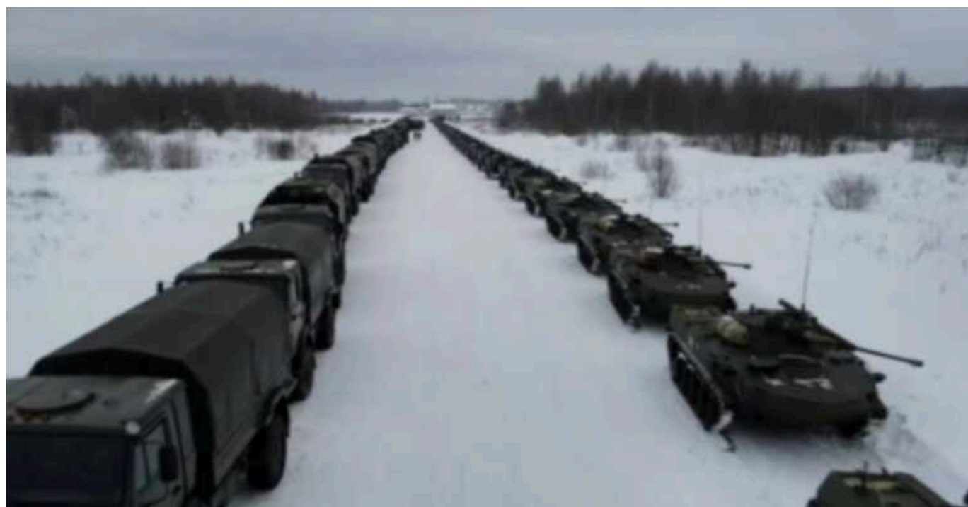
У Defense Express пояснили ймовірність нового наступу російських військ на Київ

Мобілізація в Росії та рівень збільшення надходження контингенту до російської армії, як заявив аналітик Сергій Згурець, дозволить оцінити, на яких напрямках окупанти діятимуть.