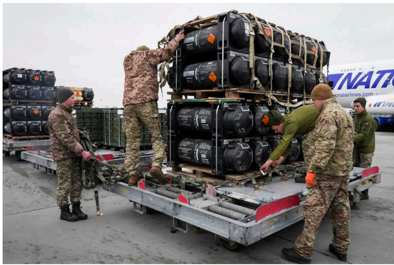
Politico: Україна вважає образливою ідею республіканців почати видавати військову допомогу США у кредит