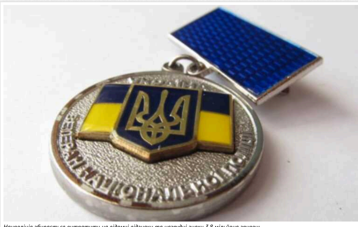
Нацполіція збирається витратити на відомчі відзнаки та нагрудні знаки 3,8 мільйона гривень

Національна поліція України оголосила тендер на виготовлення відомчих заохочувальних відзнак та нагрудних знаків Нацполу. Йдеться про понад 14 тис. штук нагород – медалей та нагрудних знаків семи видів.