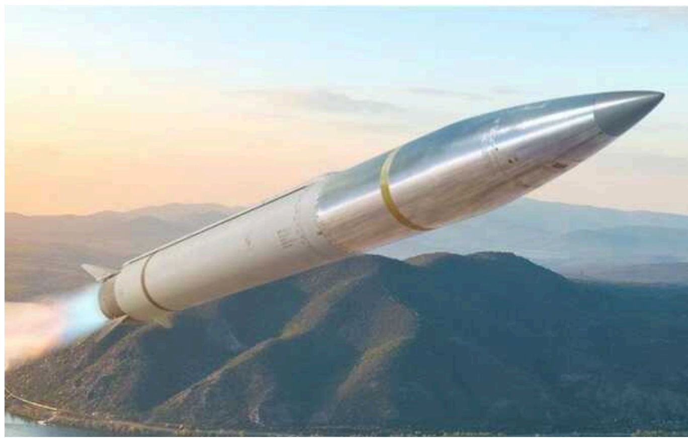
Україна минулого місяця розпочала виробництво ракет із дальністю понад 640 кілометрів, – WP

Про це йдеться у статті Washington Post.