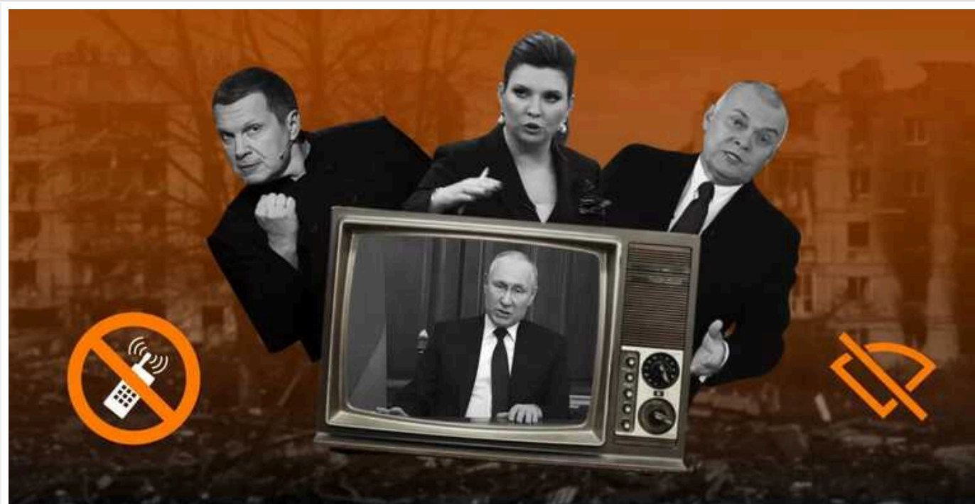
Російські загарбники знищували українські медіа на окупованих територіях

За два роки окупації російські загарбники знищили або русифікували всі українські медіа, які функціонували на тимчасово захоплених областях України. Мова йде про щонайменше 300 редакцій місцевих медіа на окупованій території у Запорізькій, Херсонській, Луганській областях. Лише одиниці редакцій змогли виїхати і відновити роботу в інших регіонах. Більшість – або закрилися, або були захоплені російськими окупантами.