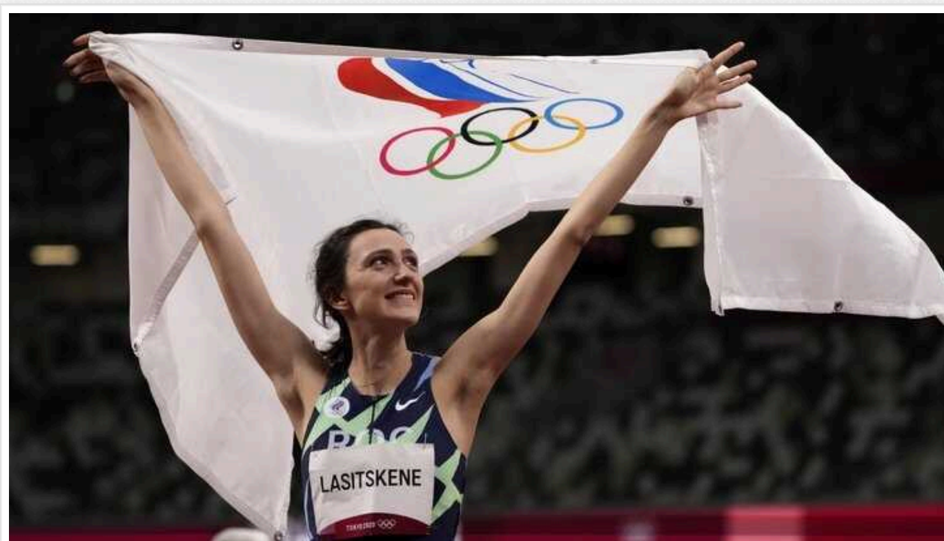
У Росії почали цькувати спортсменів, які погодяться брати участь в Олімпіаді-2024