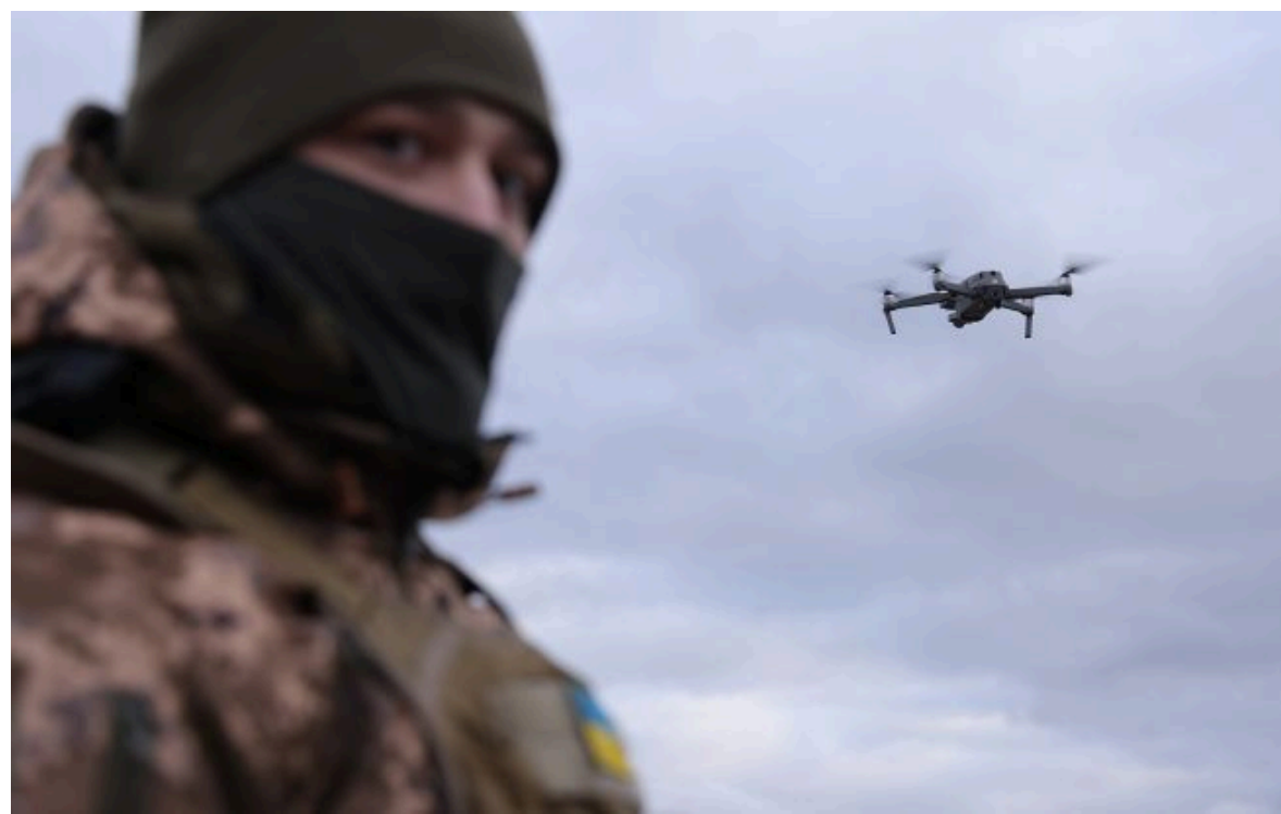
Фото: ЗСУ посилили удари по логістиці РФ, які гальмують просування ворога на фронті