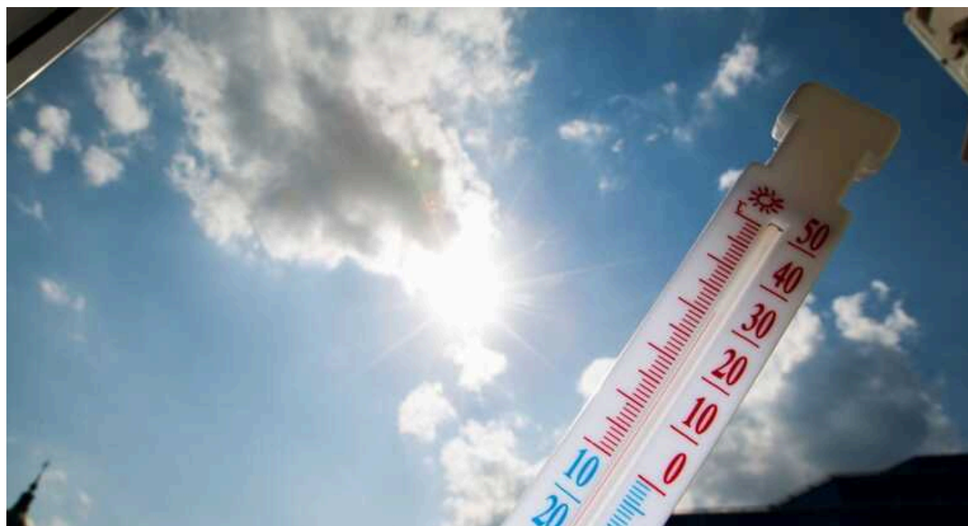
ООН: Останні десять років були найтеплішими на планеті за історію спостережень

Останні десять років були найтеплішими на планеті від початку спостережень за кліматом. Минулий 2023 рік став найтеплішим завдяки Ель-Ніньйо.