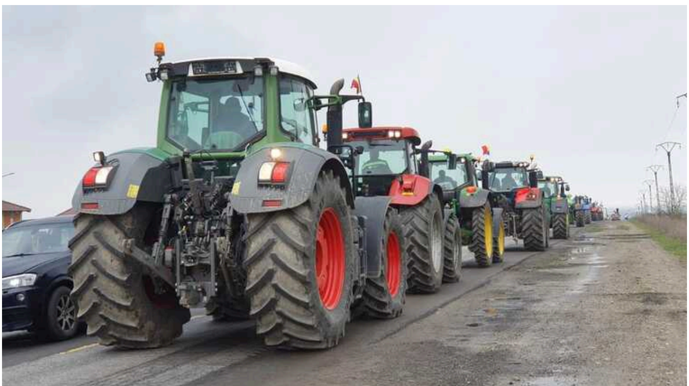
Фермери домовилися з владою Польщі про заборону транзиту українських продуктів

Влада Польщі домовилась з місцевими фермерами про заборону транзиту з України деяких аграрних продуктів. Зокрема, пшениці, кукурудзи, ріпаку та соняшника.