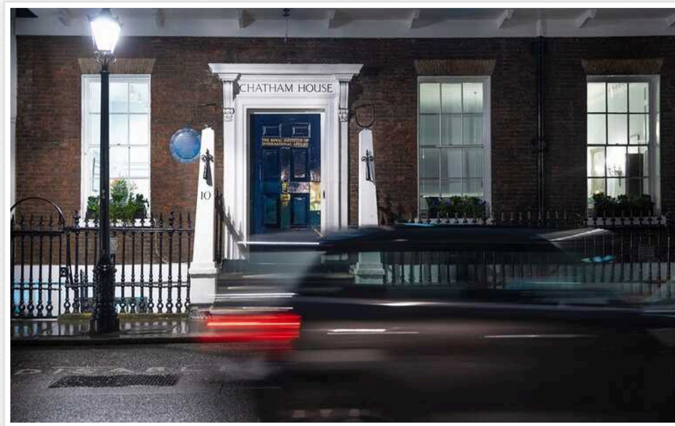
Можлива картельна змова забудовників: які ще ризики у постанові-клоні містобудівної “реформи” побачив Chatham House

Урядова постанова повторює низку положень контраверсій містобудівної “реформи” (5655), яку президент Володимир Зеленський відмовився підписати. Про це йдеться у документі “Зміцнення довгострокової стійкості в Україні. Боротьба з корупцією в час війни”, який оприлюднив Chatham House – Королівський інститут міжнародних відносин (Лондон).