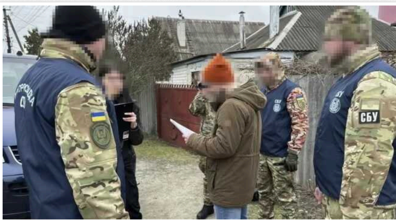
СБУ затримала колаборанта, який коригував авіаудари по Харкову

На Харківщині СБУ викрила російського агента, який з перших днів повномасштабного вторгнення РФ допомагав ворогу коригувати авіаудари по місту.