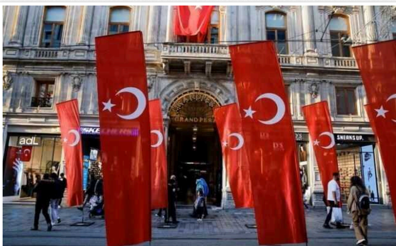
ЗМІ дізналися про угоду США та Туреччини щодо вторинних санкцій та торгівлі з РФ

Турецька місцева газета Hürriyet з посиланням на джерела повідомляє, що США та Туреччина домовилися, що турецькі компанії не одразу каратимуть за порушення санкцій і торгівлю з РФ.