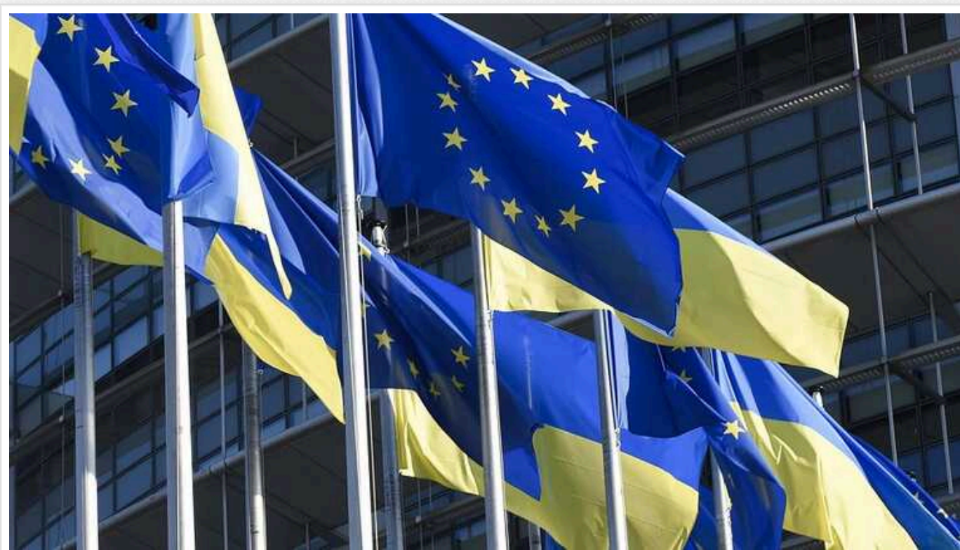
Politico: Єврокомісія сьогодні представить план, згідно з яким Україна та інші кандидати вступатимуть до ЄС поступово

Видання Politico пише, що Єврокомісія сьогодні представить план, згідно з яким Україна та інші кандидати вступатимуть до ЄС поступово, замість нинішнього підходу «все чи нічого».