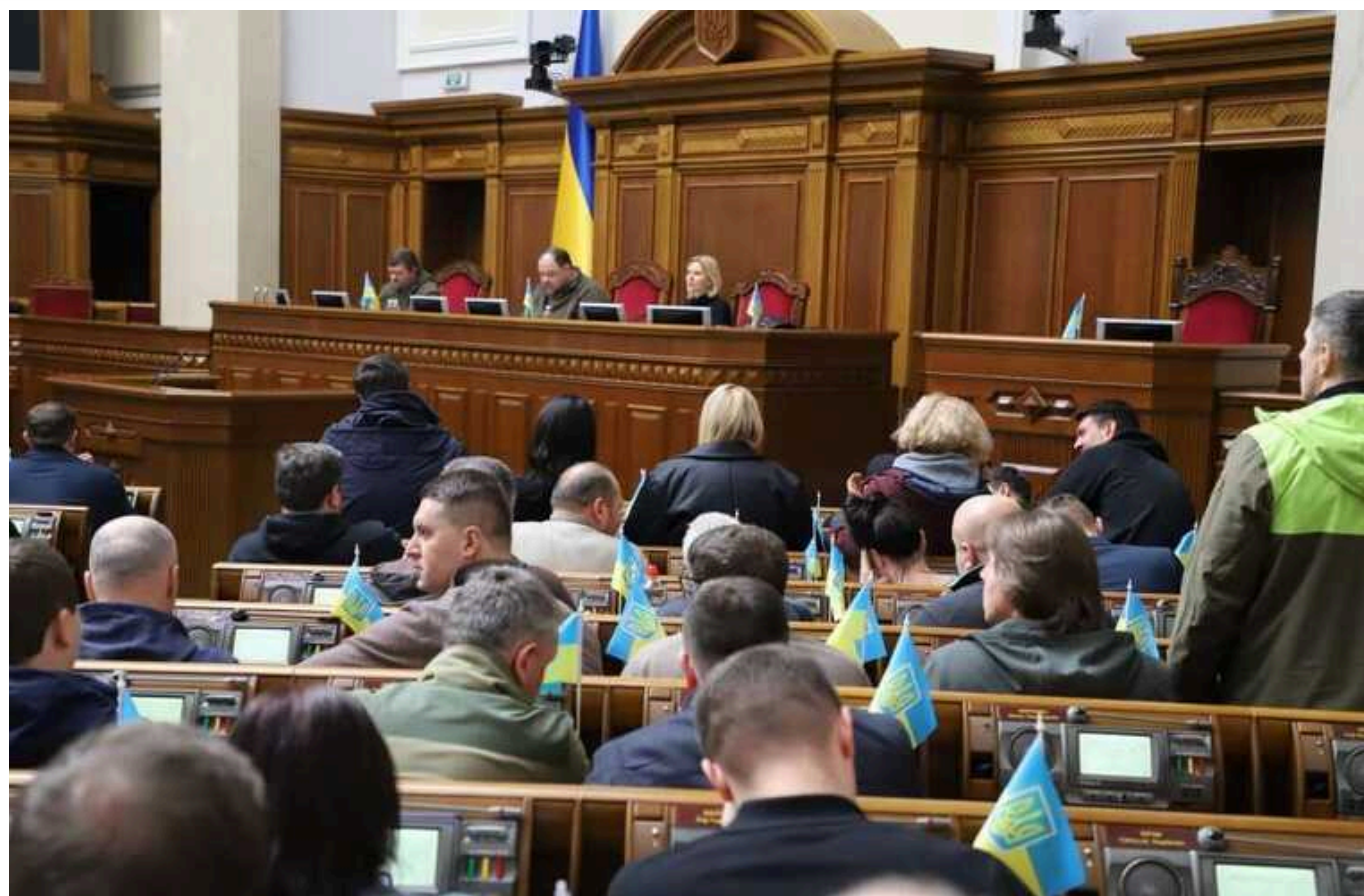
Комітет нацбезпеки вже розглянув 660 поправок до законопроекту про мобілізацію

Парламентський комітет з питань національної безпеки, оборони та розвідки на засіданні у вівторок розглянув 660 поправок до законопроекту про мобілізацію, повідомила членкиня комітету Ірина Фріз (фракція "Європейська солідарність").