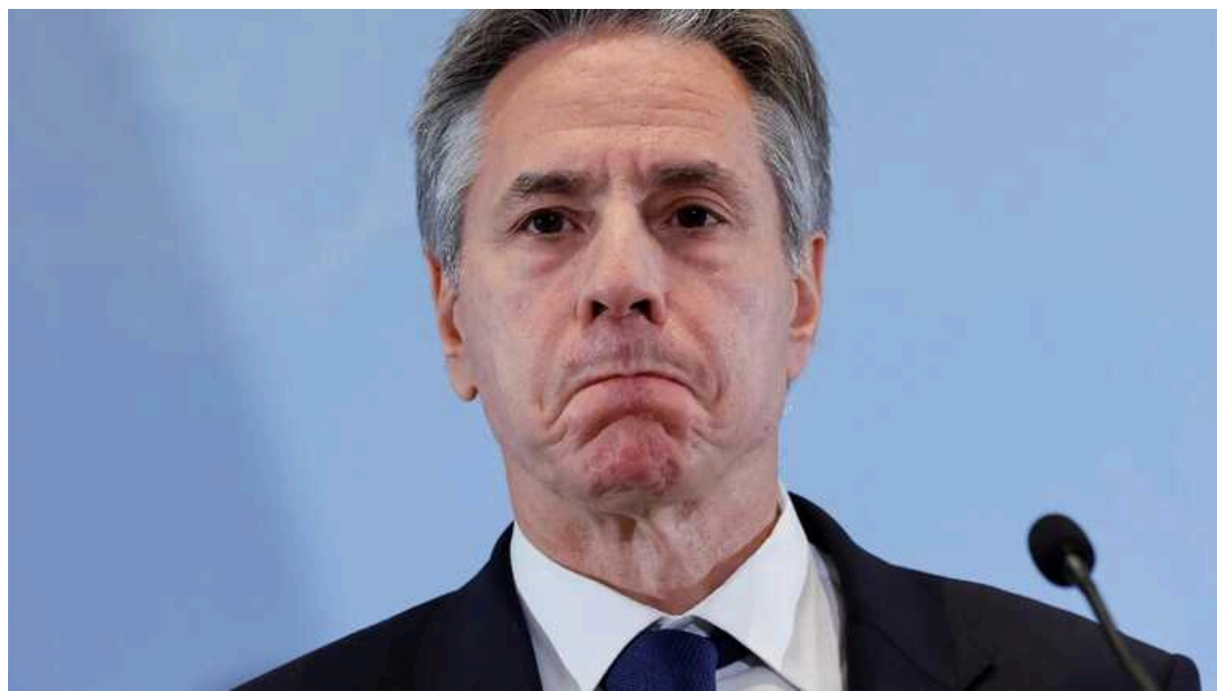
Блінкен заблокував текст заяви G7 із засудженням виборів Путіна в РФ, - La Repubblica

Видання La Repubblica пише, що держсекретар США Блінкен заблокував текст заяви G7 із засудженням виборів Путіна в РФ.