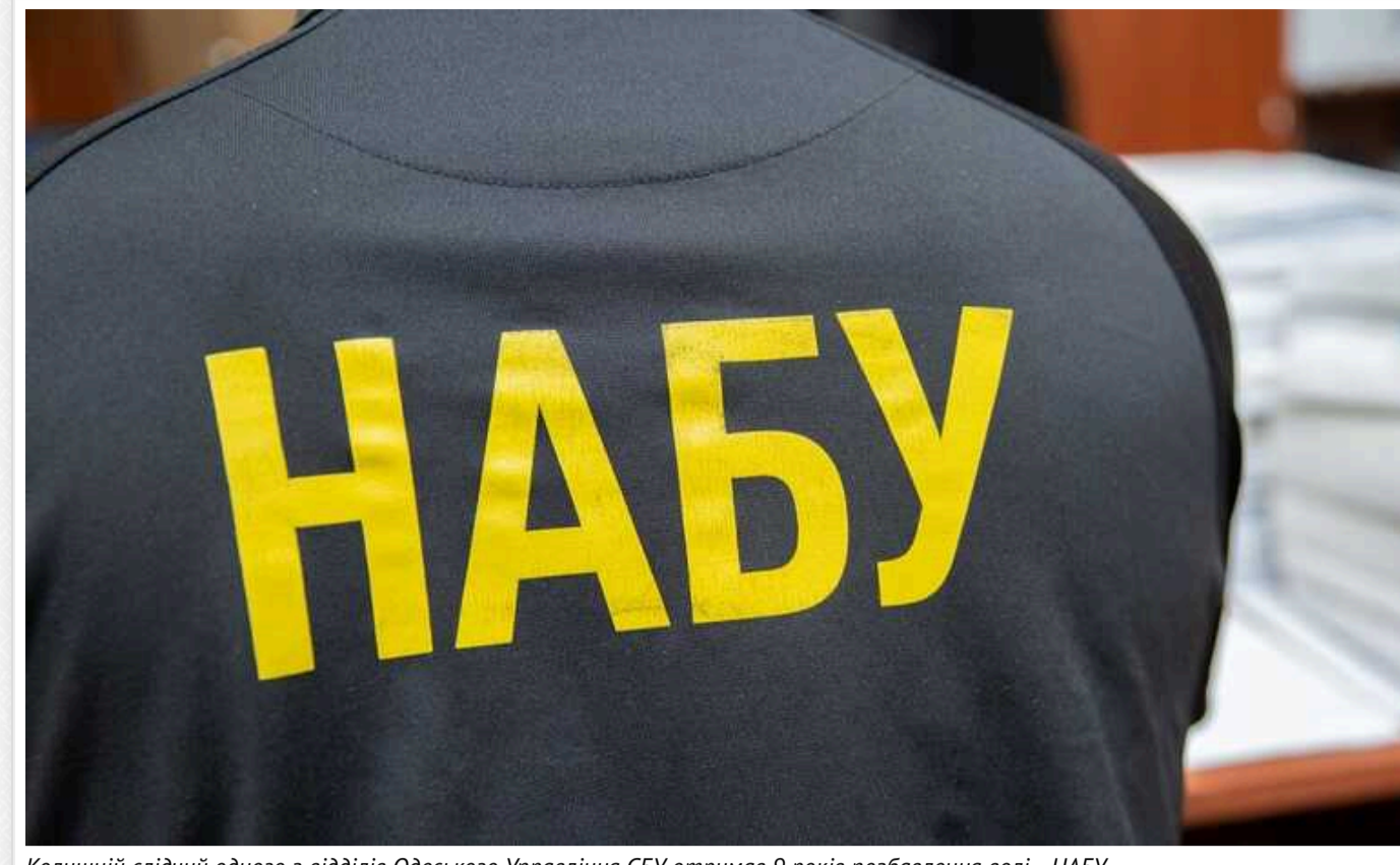
Колишній слідчий одного з відділів Одеського Управління СБУ отримав 9 років позбавлення волі, - НАБУ

У НАБУ повідомили про оголошення вироку колишньому слідчому одного з відділів Одеського Управління СБУ, який отримав 9 років позбавлення волі.