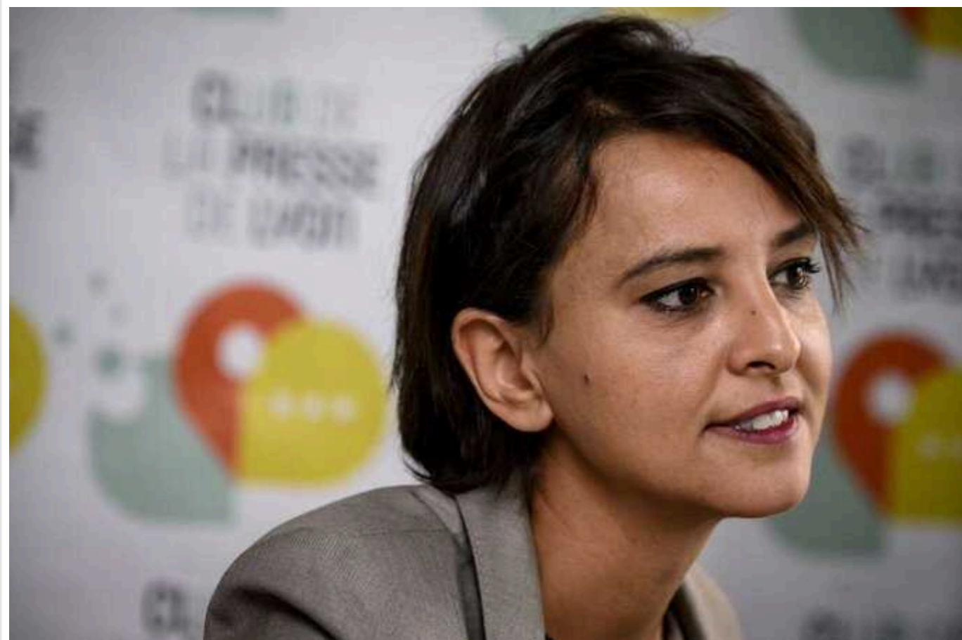
Колишній міністр освіти Франції хоче обмежити обсяг доступного людині інтернету

Колишній міністр освіти Франції, нині директор різних некомерційних організацій Наджат Валло-Белькасем закликає обмежити обсяг доступного людині інтернету.