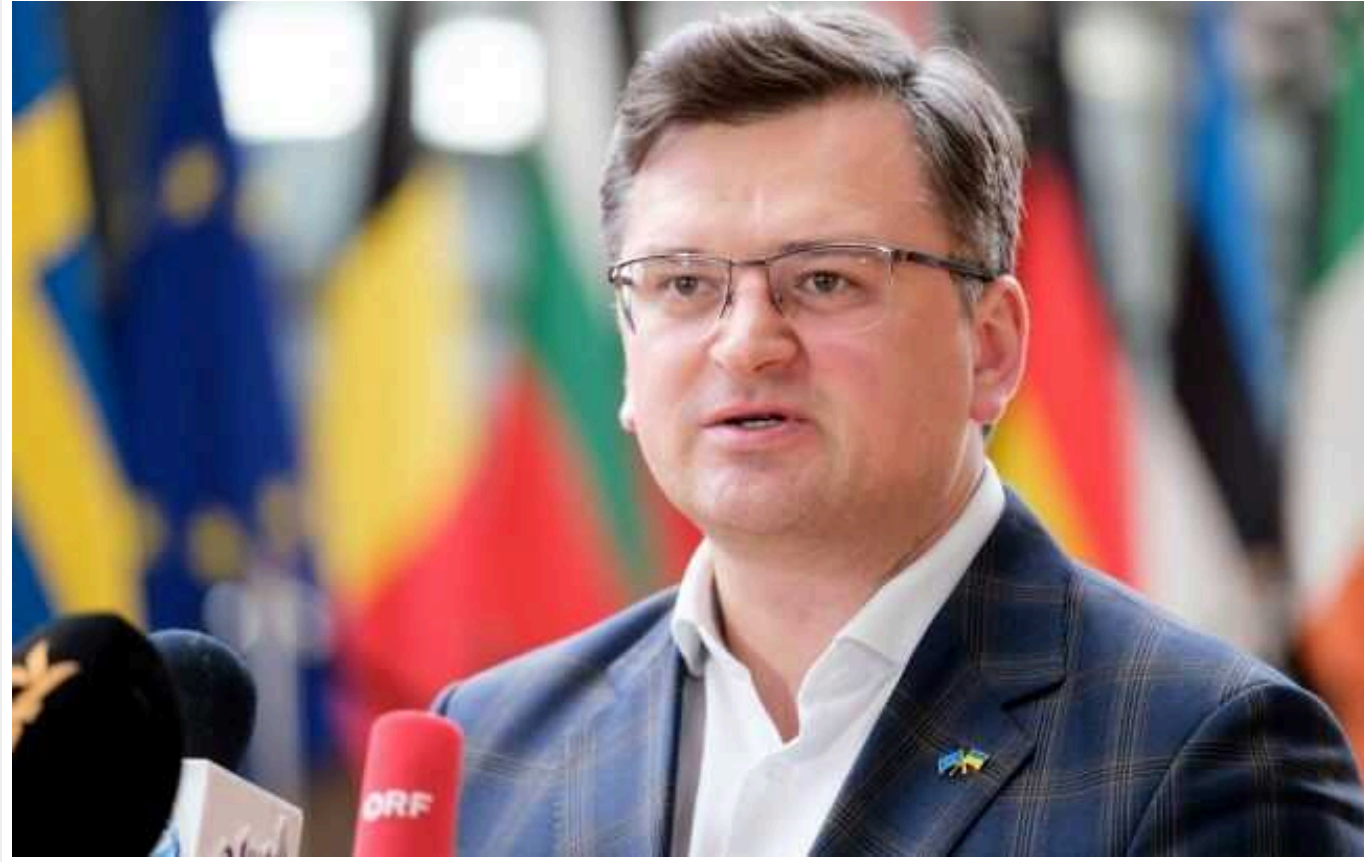
Макрон під відprawкою військ НАТО в Україну мав на увазі навчання, - Кулеба

Читати на руском Read in English Додати як бажане джерело в Google