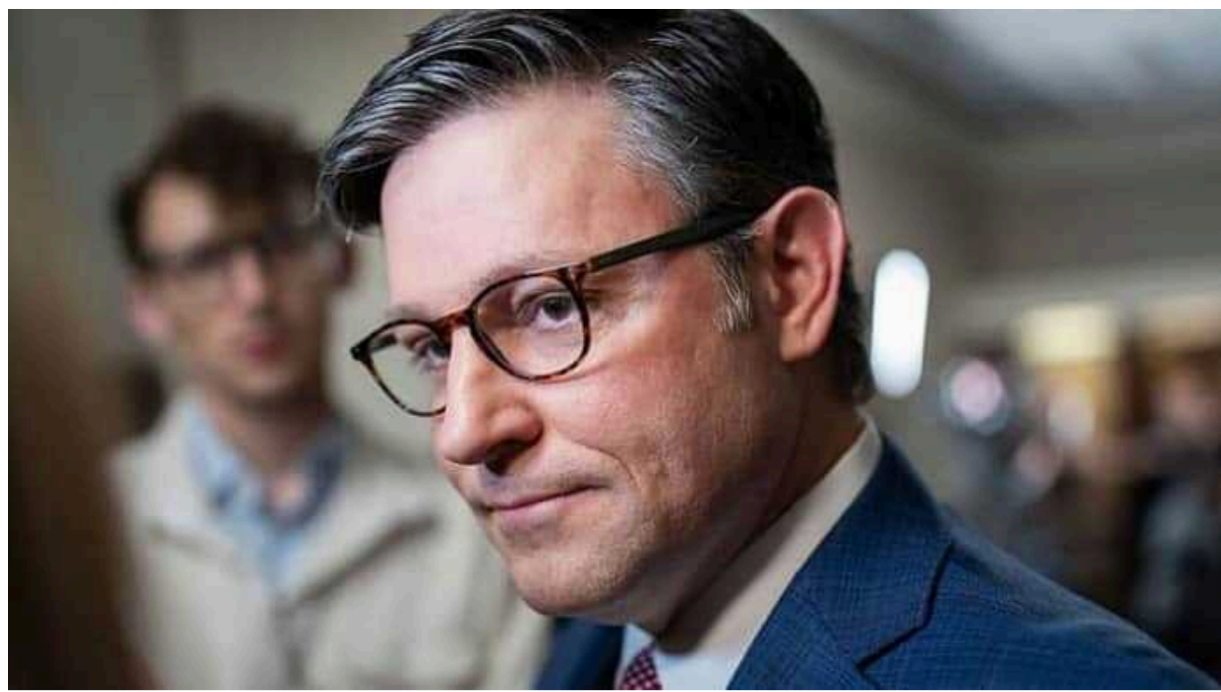
Майк Джонсон відмовився розглядати допомогу Україні, доки не буде ухвалено загальний бюджет США, - The Hill

Видання The Hill пише, що спікер Палати представників Джонсон відмовився розглядати допомогу Україні, доки не буде ухвалено загальний бюджет США.