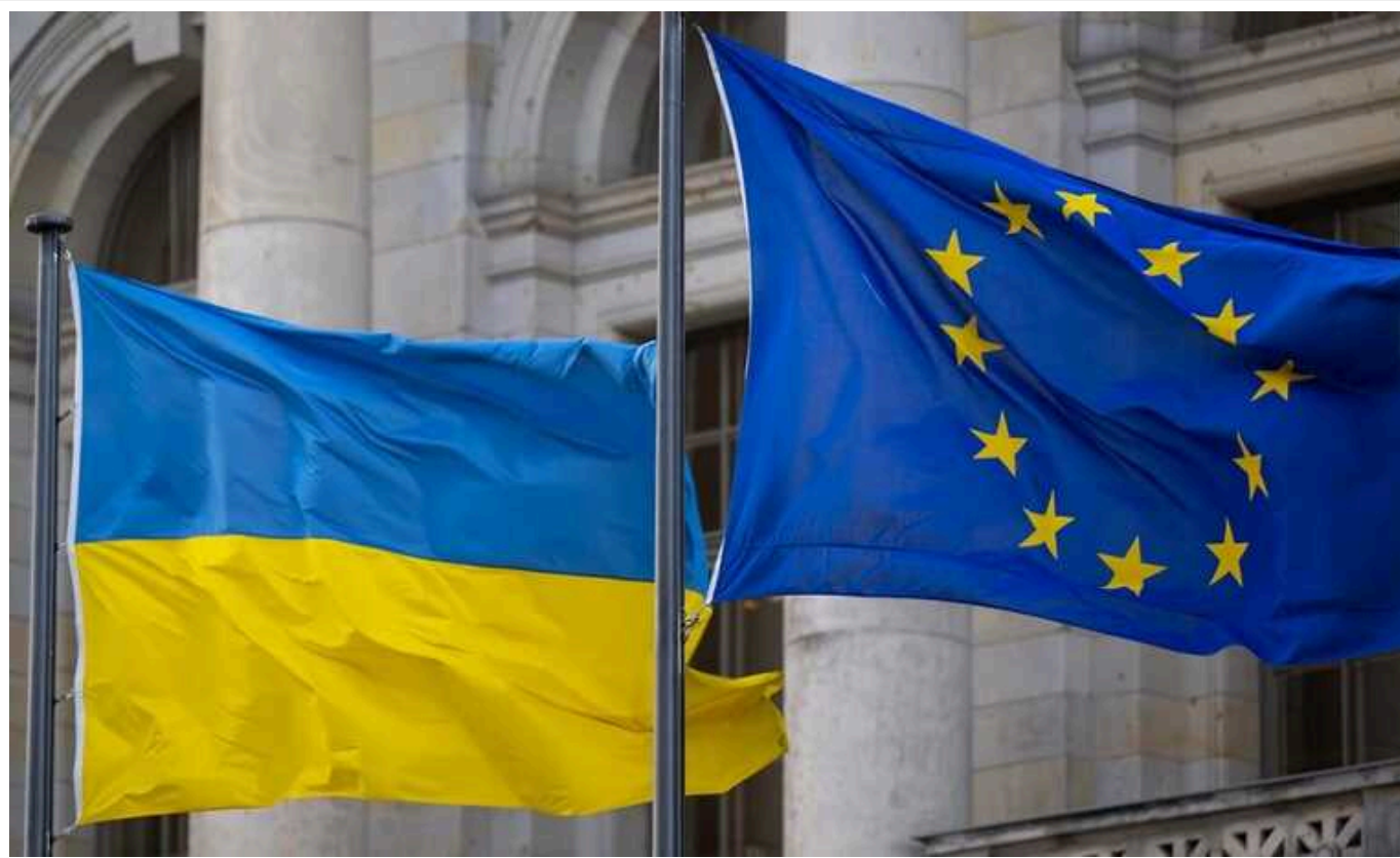
В ЄС попередньо погодили продовження безмитного експорту сільгосппродукції України

У середу, 19 березня, Європарламент та Європейська Рада досягли попередньої домовленості щодо продовження заходів лібералізації торгівлі для України на тлі агресивної війни Росії.