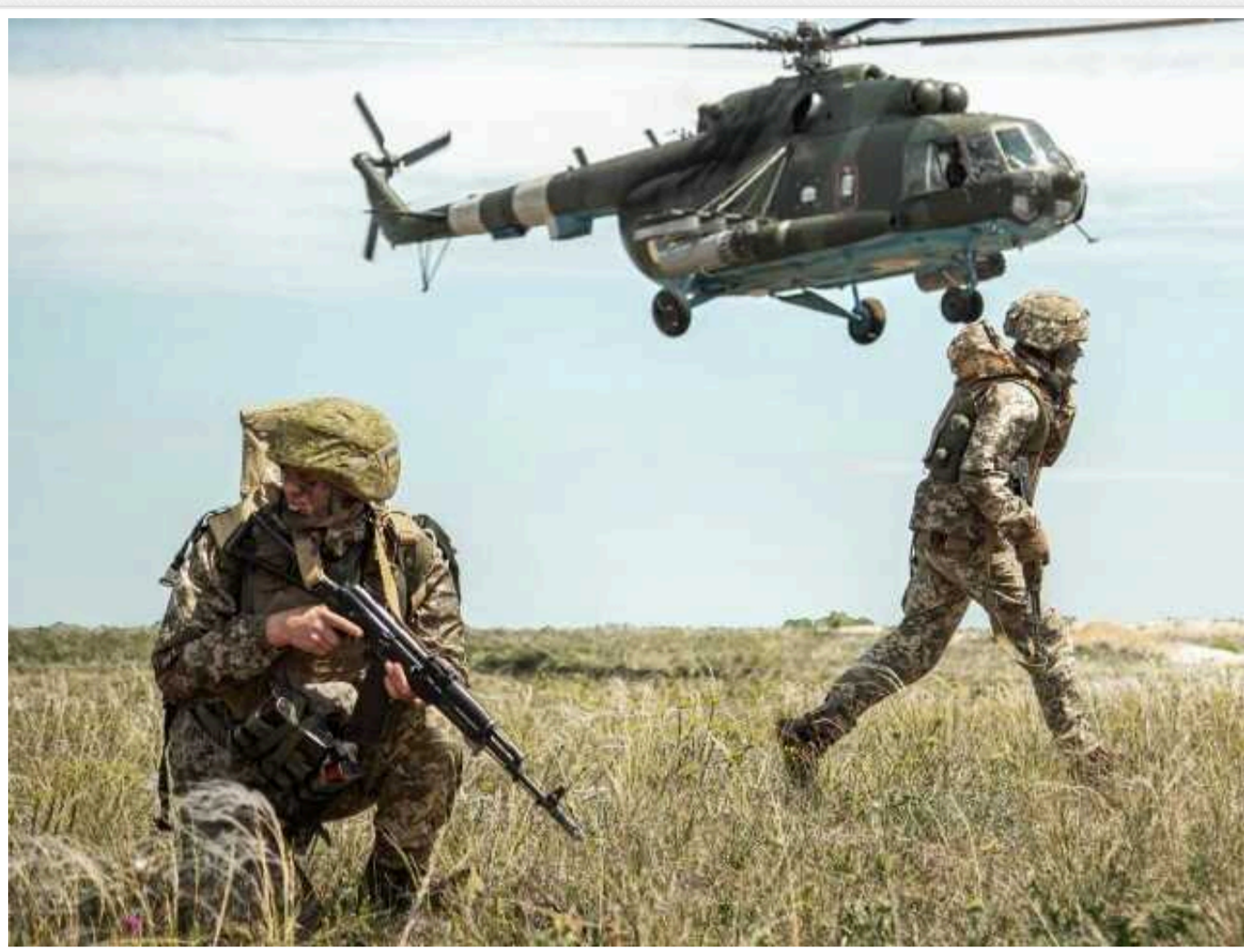
Ситуація на фронті: минулої доби сталося 80 бойових зіткнень

Українські військові відбили 29 атак противника на Новопавлівському напрямку, утримали позиції та відбили штурми окупаційних військ на Херсонському напрямку. Рaketні війська вдарили по наземному пункту управління безпілотниками супротивника.