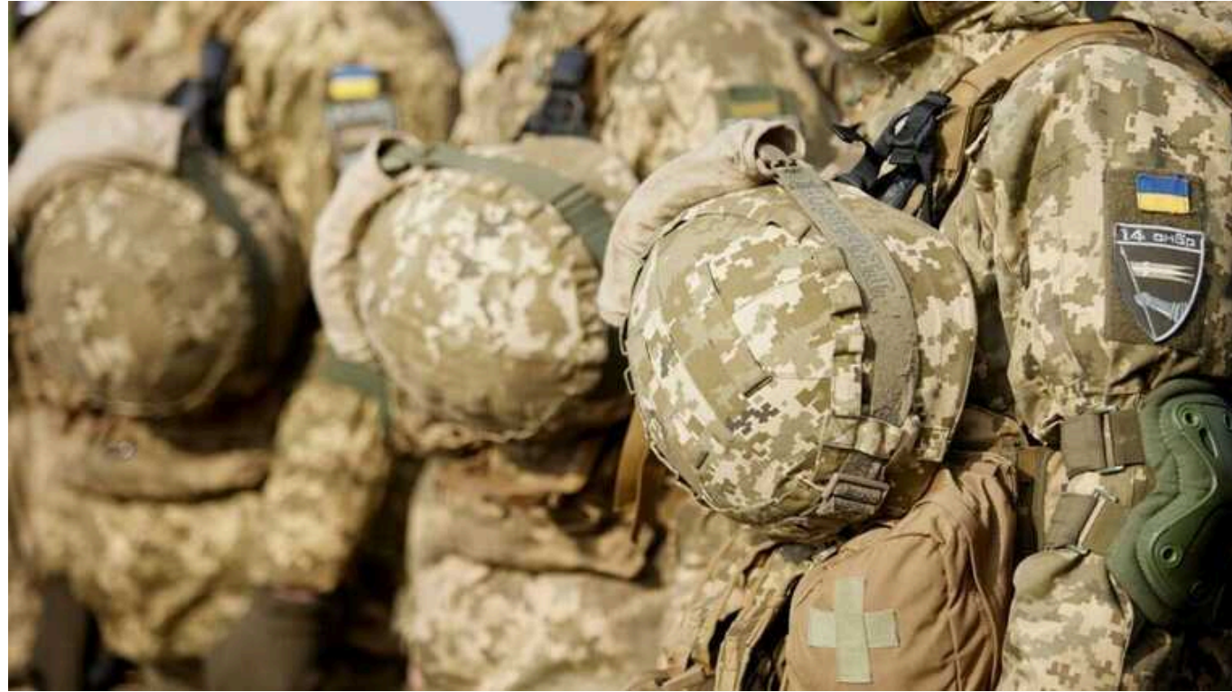
В Житомирі чоловік із кулаками накинувся на співробітника ТЦК: за фактом хуліганства поліція відкрила кримінальне провадження

Як розповідає військовий, він ішов вулицею і нікого не чіпав. 33-річний чоловік спочатку почав лаятись, а далі намагався вдарити.