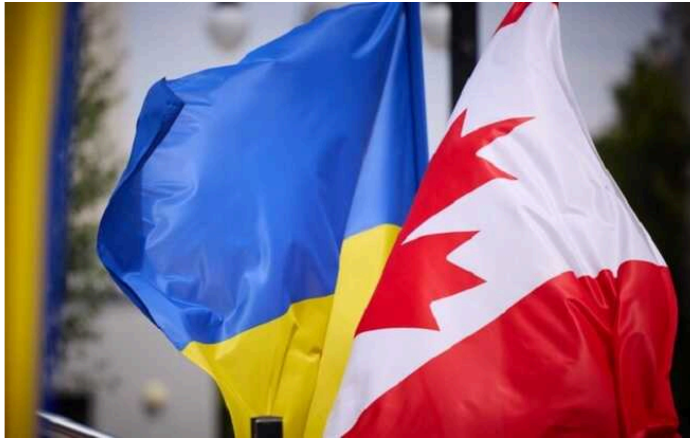
Канада передасть українським військовим партію приладів нічного бачення

Канада у рамках нової військової допомоги передасть Україні партію приладів нічного бачення.