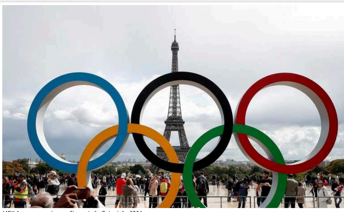
МОК допустив росіян та білорусів до Олімпіади-2024

У МОК прогнозують, що відбір на Олімпіаду-2024 пройдуть 36 росіян та 22 білоруси. Ці числа в 10 разів менші за кількість громадян РФ і Білорусі, які брали участь в Олімпіаді в Токіо у 2021 році.