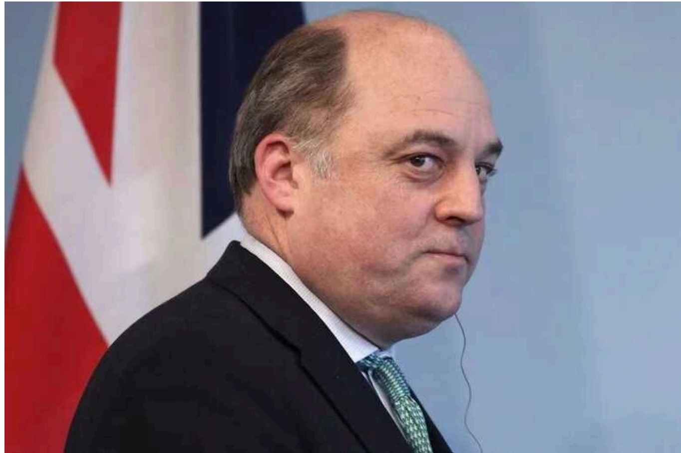
У Британії пояснили, для чого потрібні дискусії щодо відправлення військ в Україну

Експерт оборони Великої Британії Бен Уоллес вважає, що розмови щодо потенційної участі західних військ у війні в Україні є частиною стримування ворога.