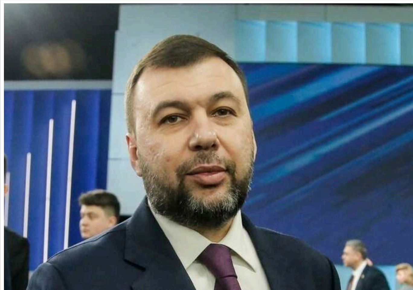
Пушилін пообіцяв навчити мешканців Білгородщини жити в умовах "СВО"

Так звані "влада ДНР" готова інструктувати жителів Білгородської області, як жити в умовах "СВО".