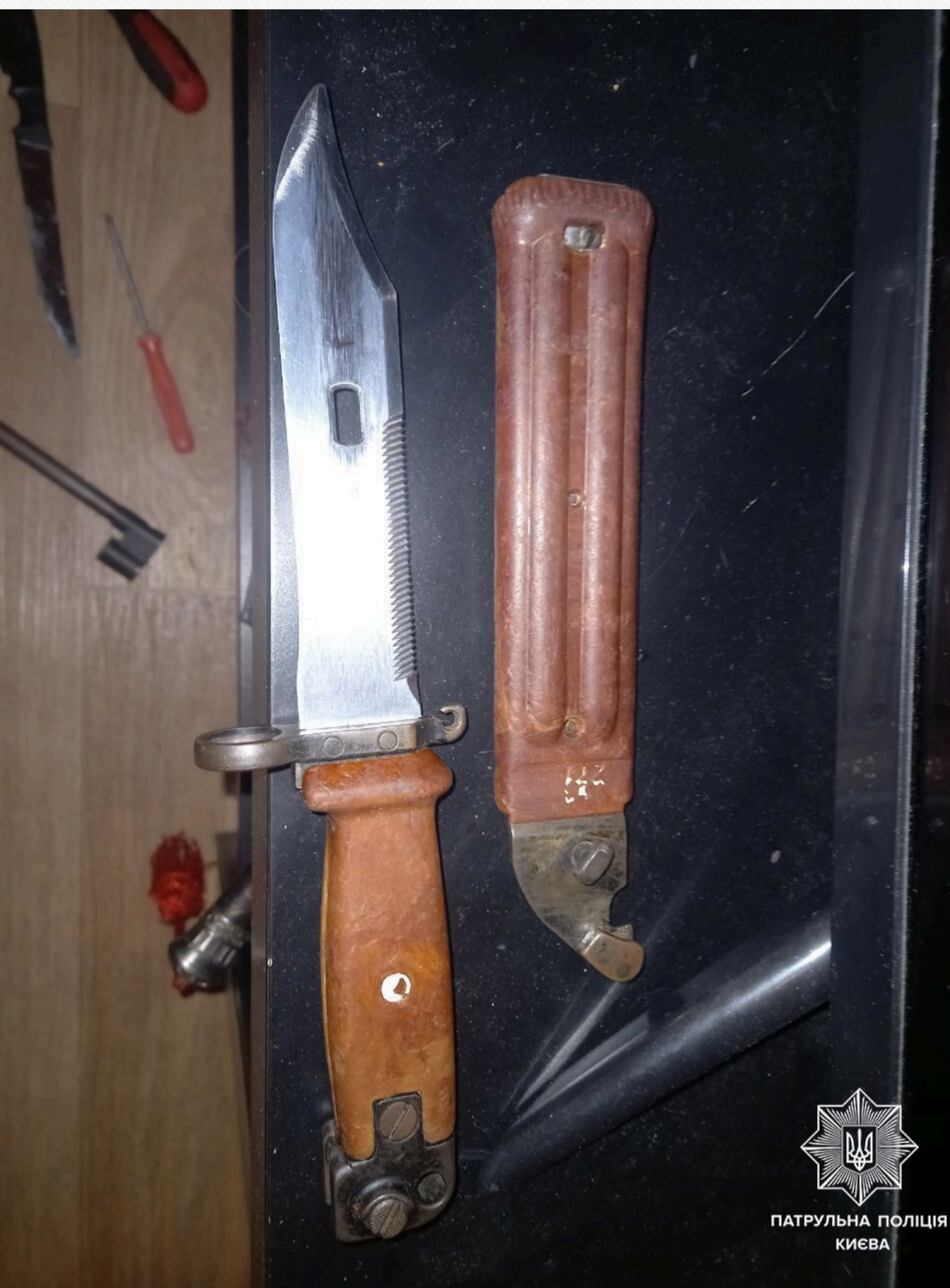
ПАТРУЛЬНА ПОЛІЦІЯ КИЄВА

"Патрульні швидко прибули на місце виклику та спробували потрапити до вказаної квартири, аби заспокоїти гучну компанію. Двері відчинили двоє чоловіків, які одразу почали агресивно поводитися та не реагували на зауваження поліцейських. Окрім того, ми помітили в одного з них предмет, схожий на пістолет. Обох порушників інспектори затримали. Оглянувши помешкання, ми виявили чимало предметів, схожих на зброю", – додали у пресслужбі.