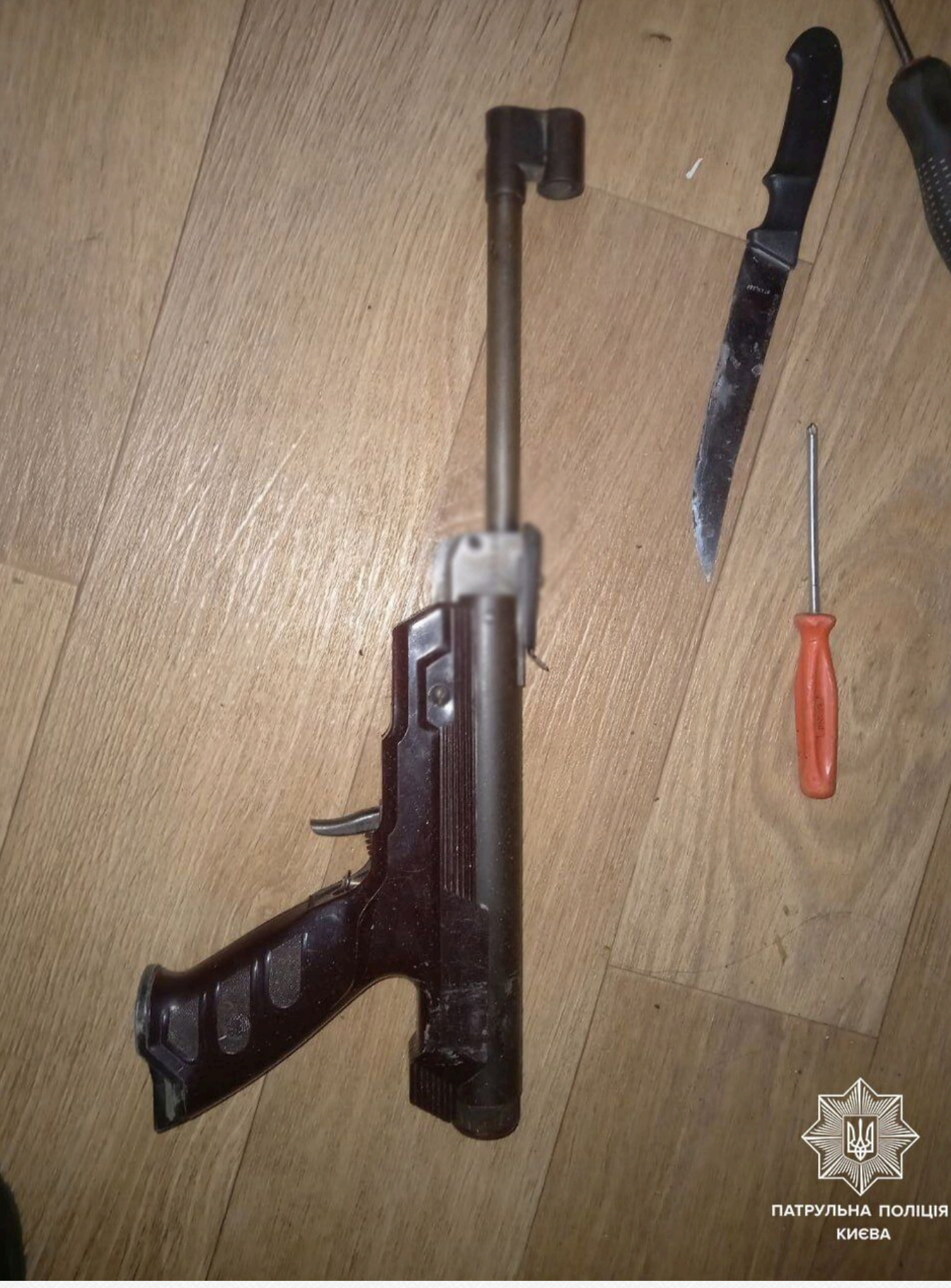
ПАТРУЛЬНА ПОЛІЦІЯ КИЄВА

Теги: Зброя Оружжя Націоналізм Націоналісти Київ Києв