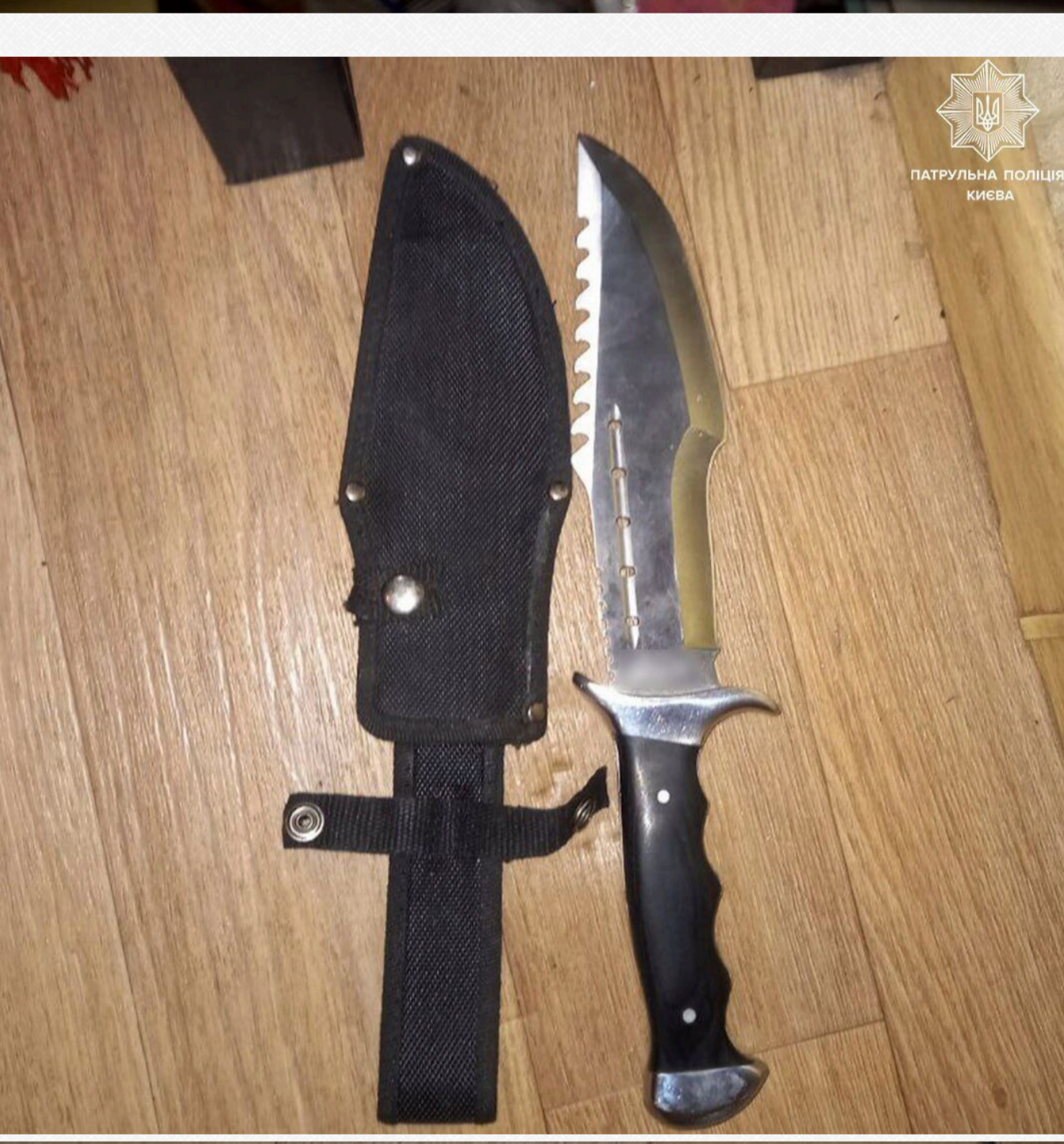
ПАТРУЛЬНА ПОЛІЦІЯ КИЄВА