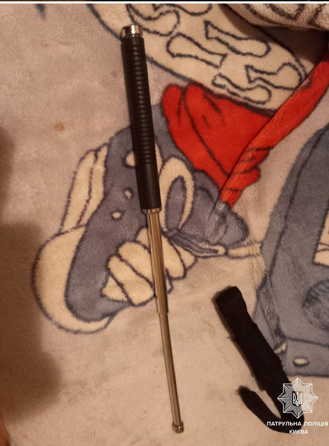
ПАТРУЛЬНА ПОЛІЦІЯ КИЄВА