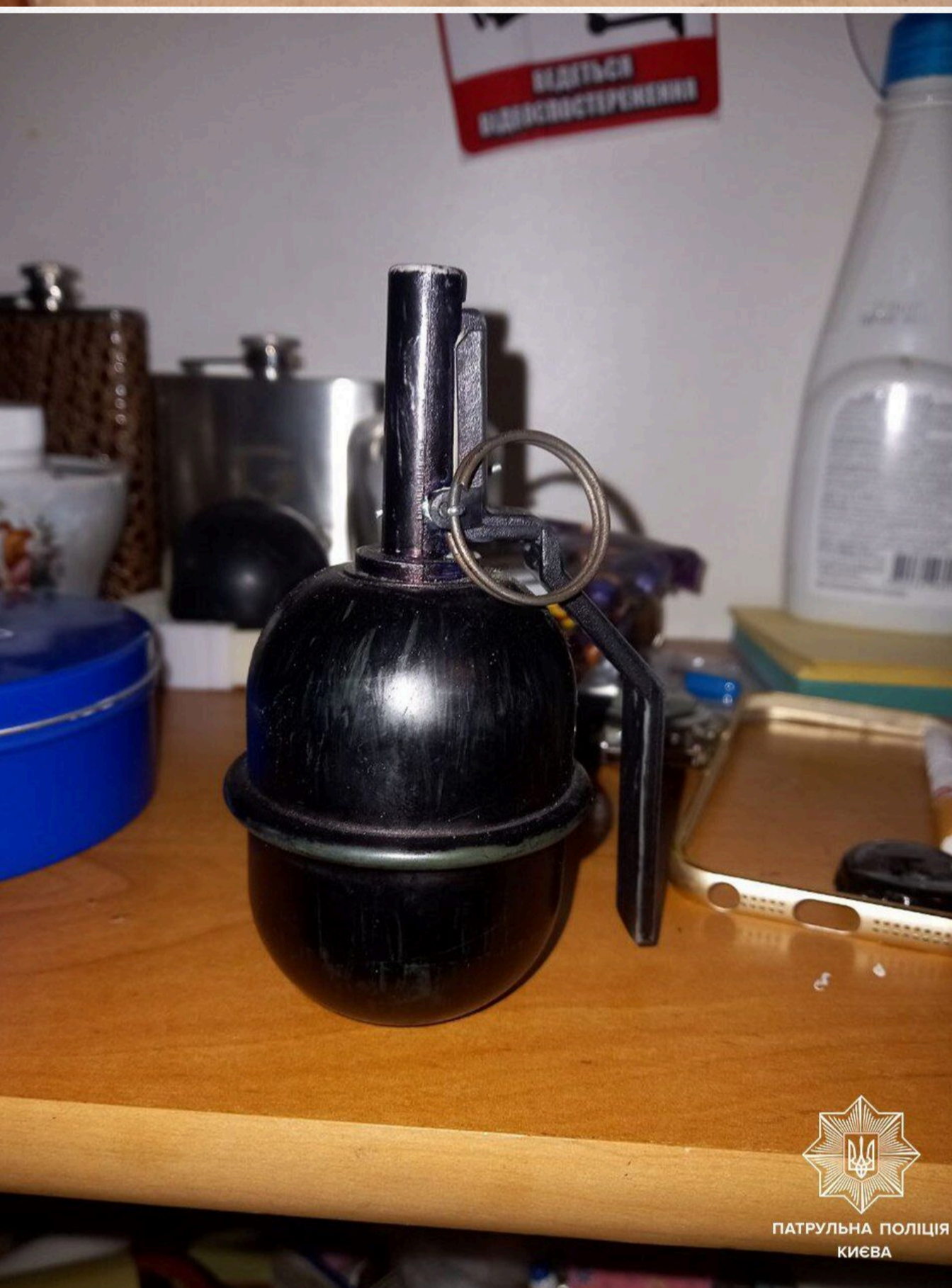
ПАТРУЛЬНА ПОЛІЦІЯ КИЄВА