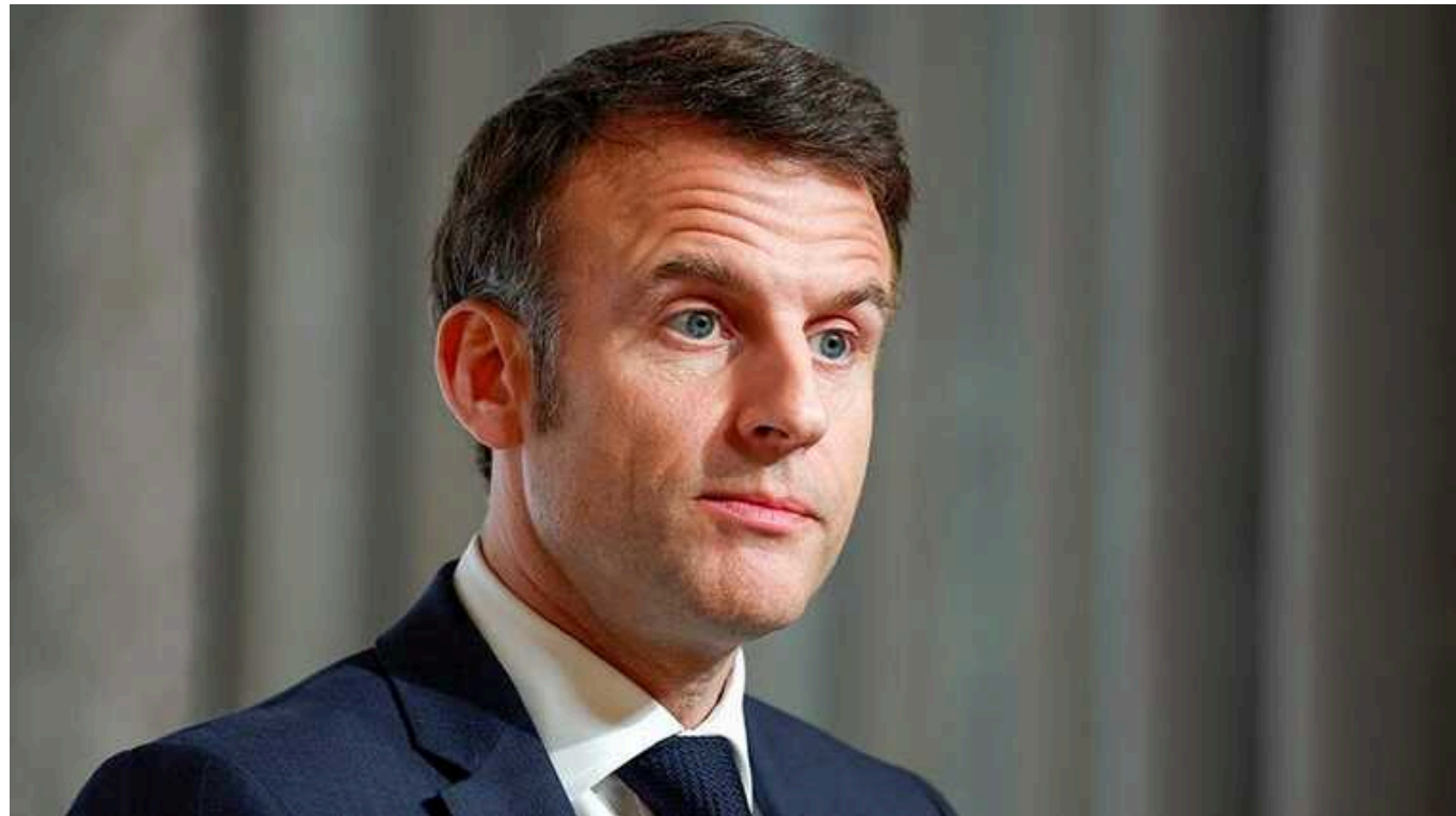
Макрон пояснив наслідки для Франції у разі перемоги Росії в Україні

Для Франції будуть "прямі наслідки", якщо Російська Федерація переможе Україну у війні. Невідомо, де зупиниться імперіалістична Росія, тому "наші демократії завжди потрібно захищати".