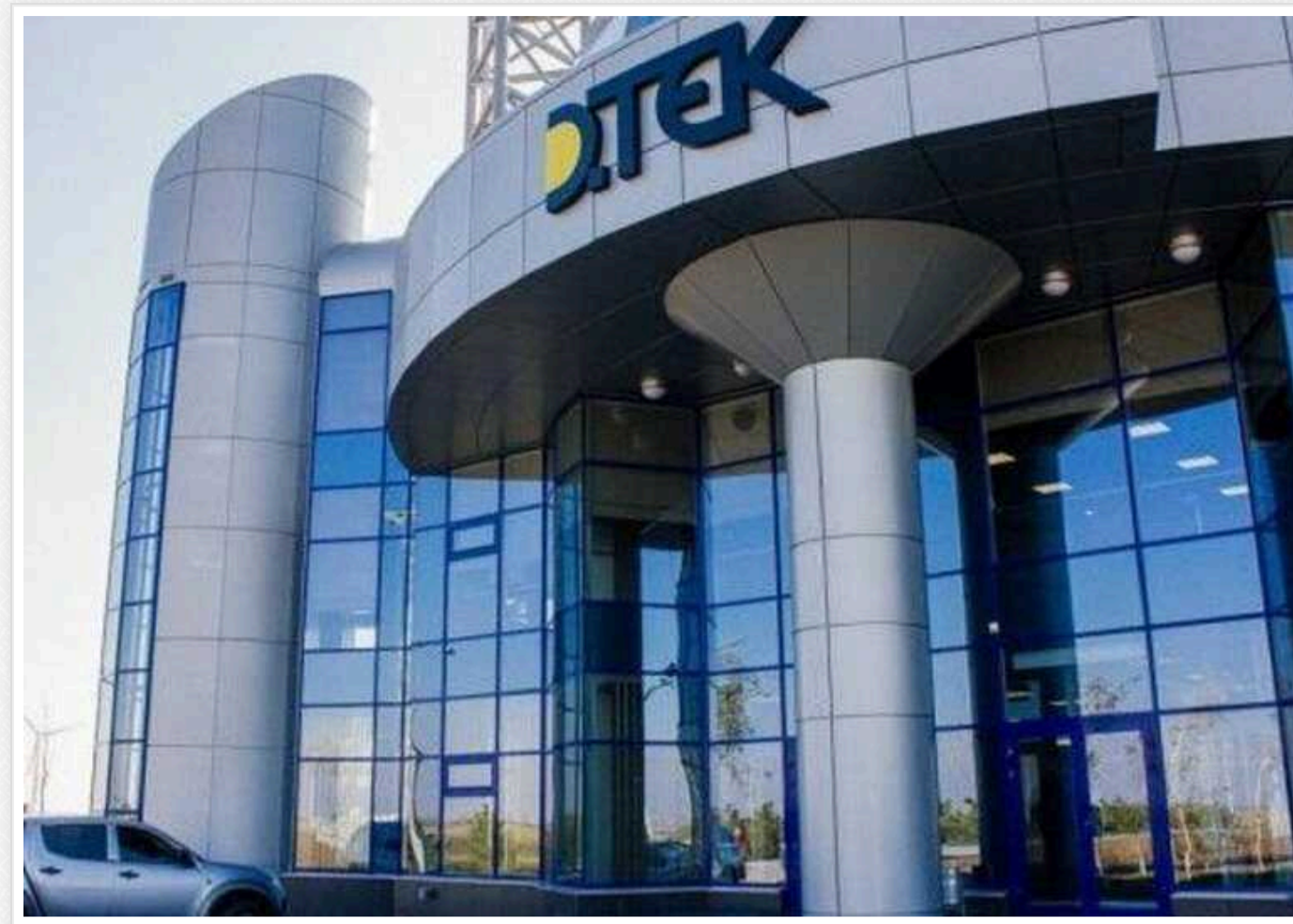
Одеський ДТЕК заплатить понад 2 мільйони гривень за порушення договору про підключення ЖК

Понад 2 млн гривень виплатить Акціонерне товариство "ДТЕК Одеські електромережі" будівельній компанії "Фамільний дім" за зрив термінів підключення житлового комплексу до електричних мереж системи розподілу.