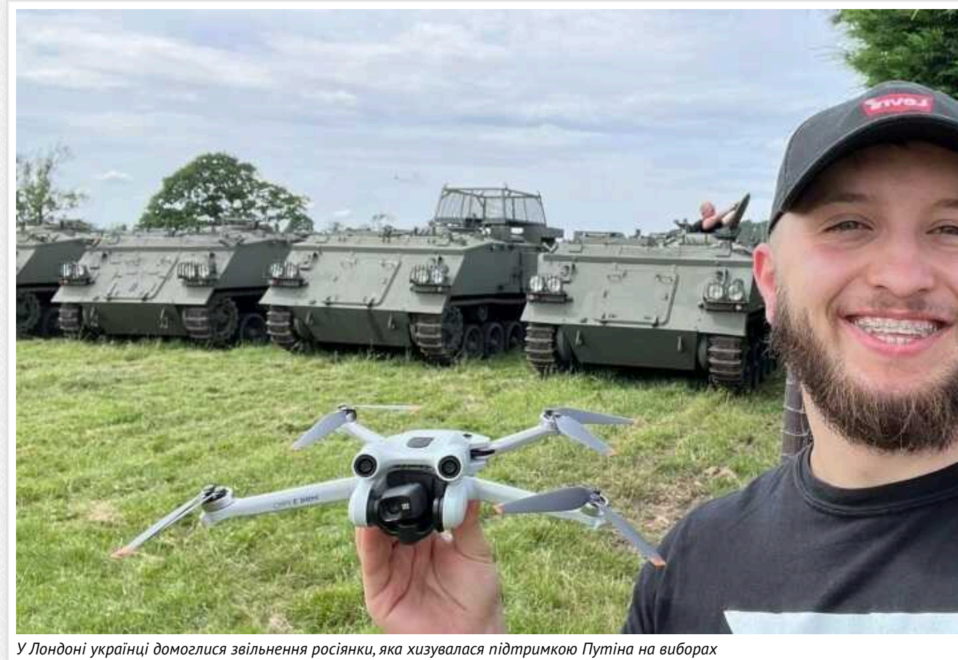
У Лондоні українці домоглися звільнення росіянки, яка хизувалася підтримкою Путіна на виборах

Волонтер звернув увагу на пости росіянки в соцмережах і повідомив про це її роботодавцю.