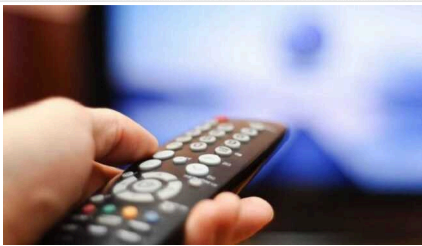
На Харківщині та Сумщині відновили доступ до сигналу українського мовлення майже на всіх об'єктах, - Держспецзв'язок

На Сумщині та Харківщині фахівці Концерну радіомовлення радіозв'язку та телебачення відновили доступ до сигналу радіоканалів та українського телебачення у Лозовій, Кегичівці, Ізюмі, Сумах, Тростянці та Шостці.