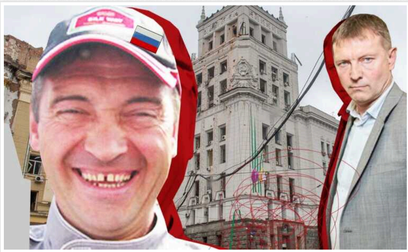
Бізнес-партнер харківського депутата заплатив 20 мільйонів рублів податків у РФ