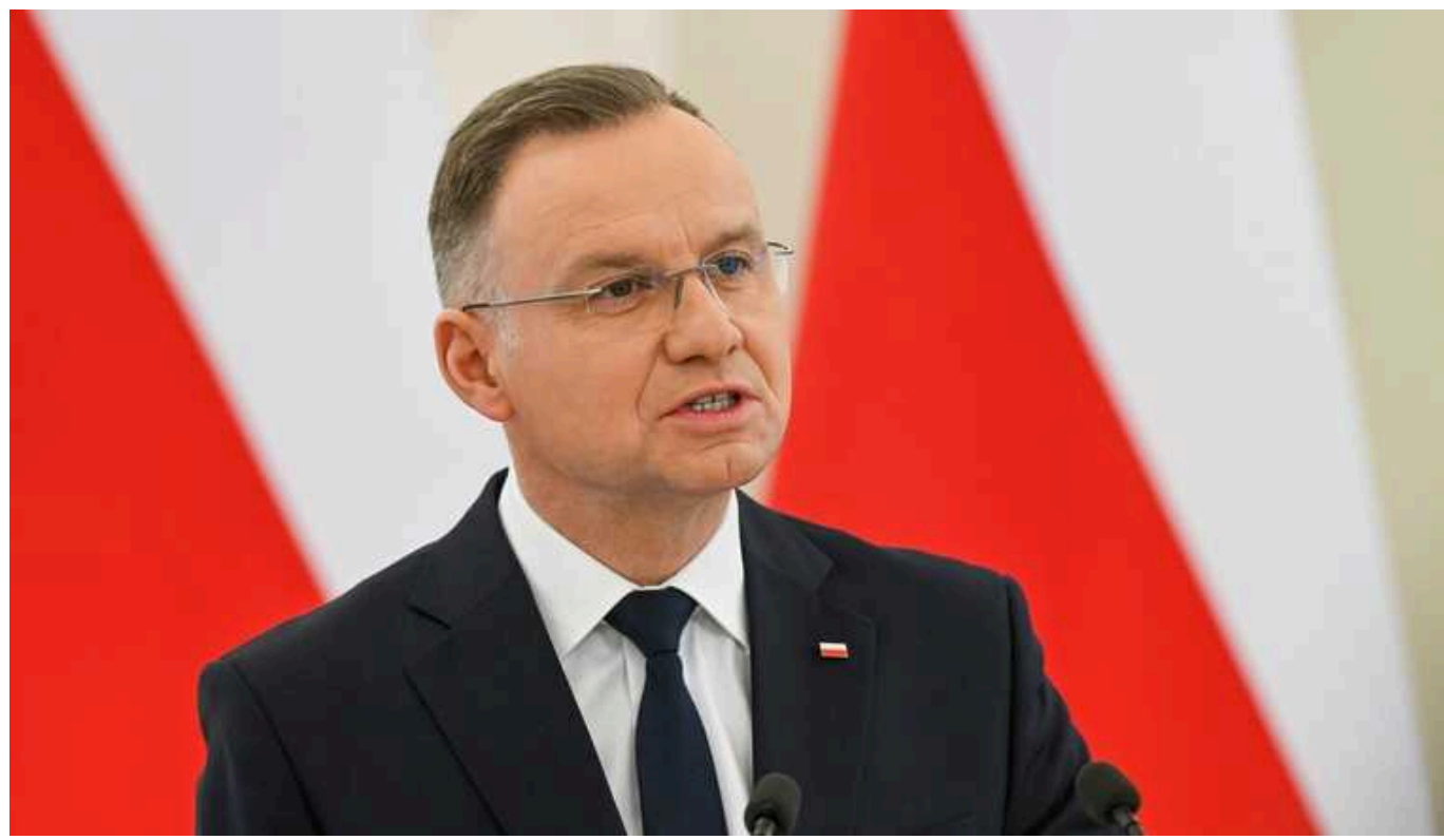
Росія може відновити свій військовий потенціал і напасти на країни НАТО у 2026 році, – Дуда

Президент Польщі Анджей Дуда заявив, що РФ незабаром може відновити свій військовий потенціал та напасти на країни НАТО вже у 2026 році.