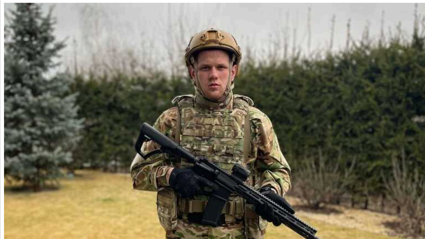
"Нестача піхоти": ЗСУ не стримають росіян без мобілізації, – "Вовки Да Вінчі"