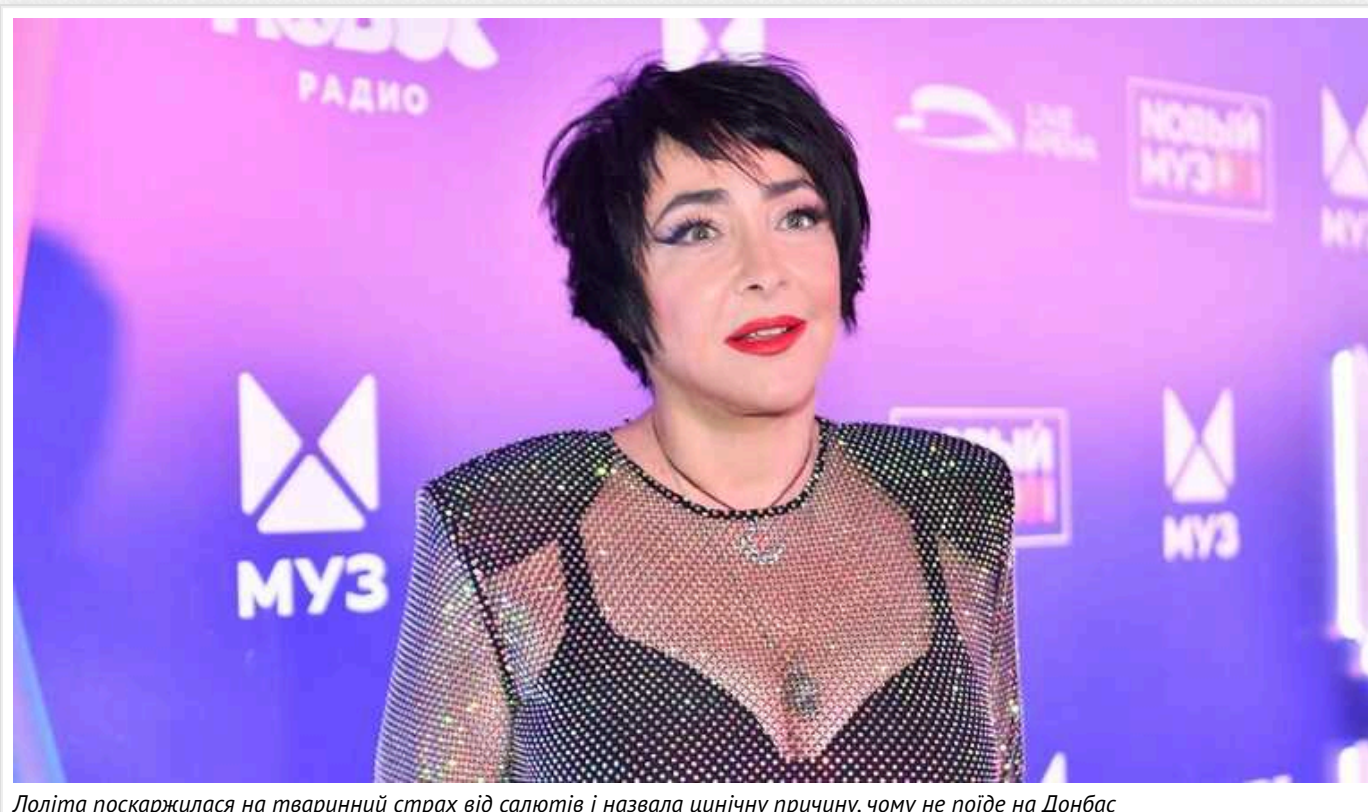
Лоліта поскаржилася на тваринний страх від салютів і назвала цинічну причину, чому не поїде на Донбас

Уродженка Закарпаття та зрадниця України, співачка Лоліта Мілявська, яка навідріз відмовилася їхати на окупований Донбас, пояснила своє рішення "тваринним страхом". Поки українців щодня вбиває Росія, обстрілюючи житлові будинки та громадські місця ракетами, запроданка видала, що боїться салютів після того, як раз почула вибухи в окупованому Донецьку.