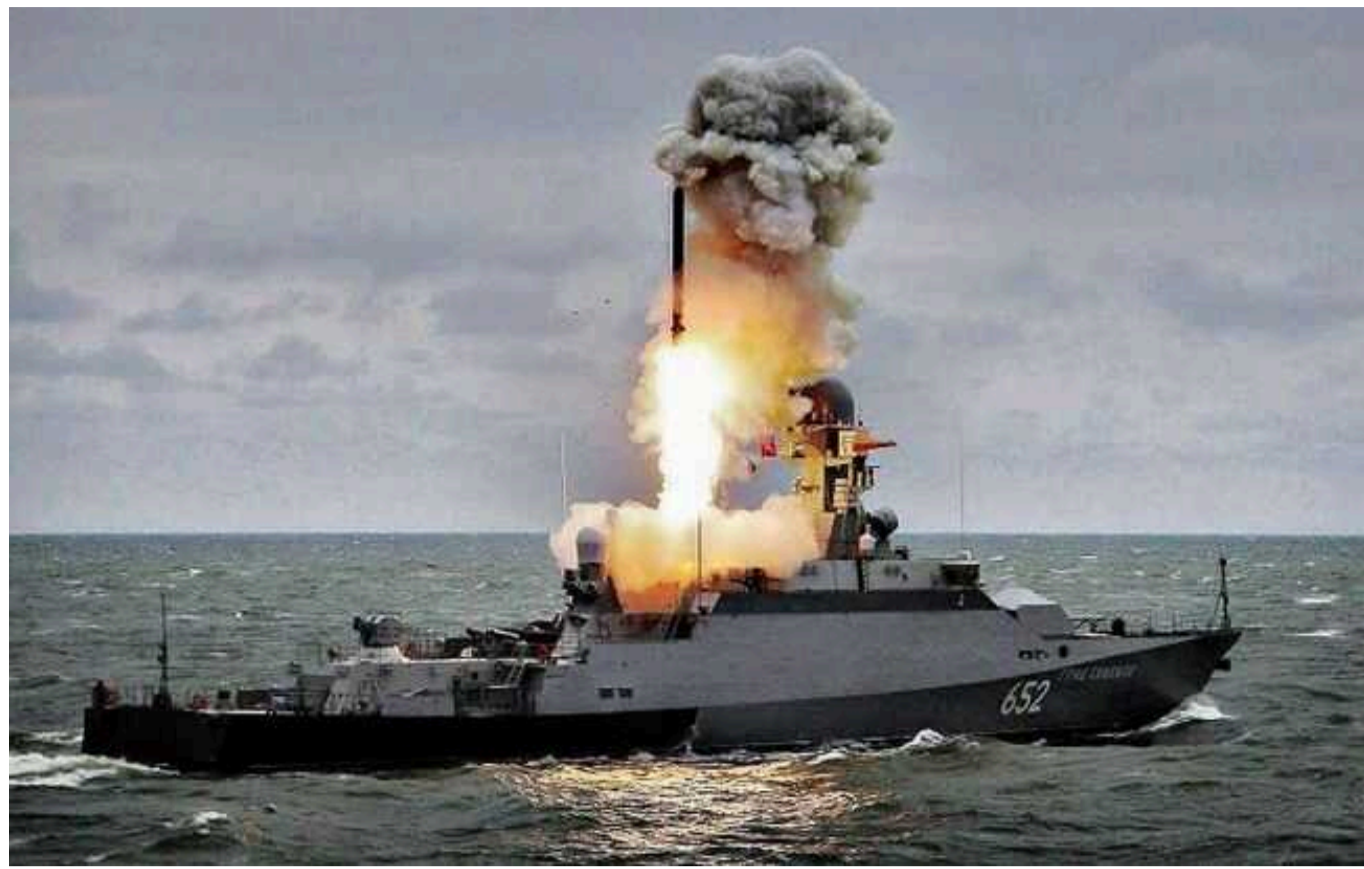
РФ активізувала зусилля зі збереження свого флоту у Чорному морі: у Британській розвідці пояснили, що стоїть за візитом Шойгу в Крим

Міністр оборони Росії Сергій Шойгу був змушений здійснити поїздку до тимчасово окупованого Криму через успішну морську ударну кампанію України. Він затвердив нові заходи для підрозділів ЧФ для зменшення загрози від безпілотних літальних апаратів і морських дронів.