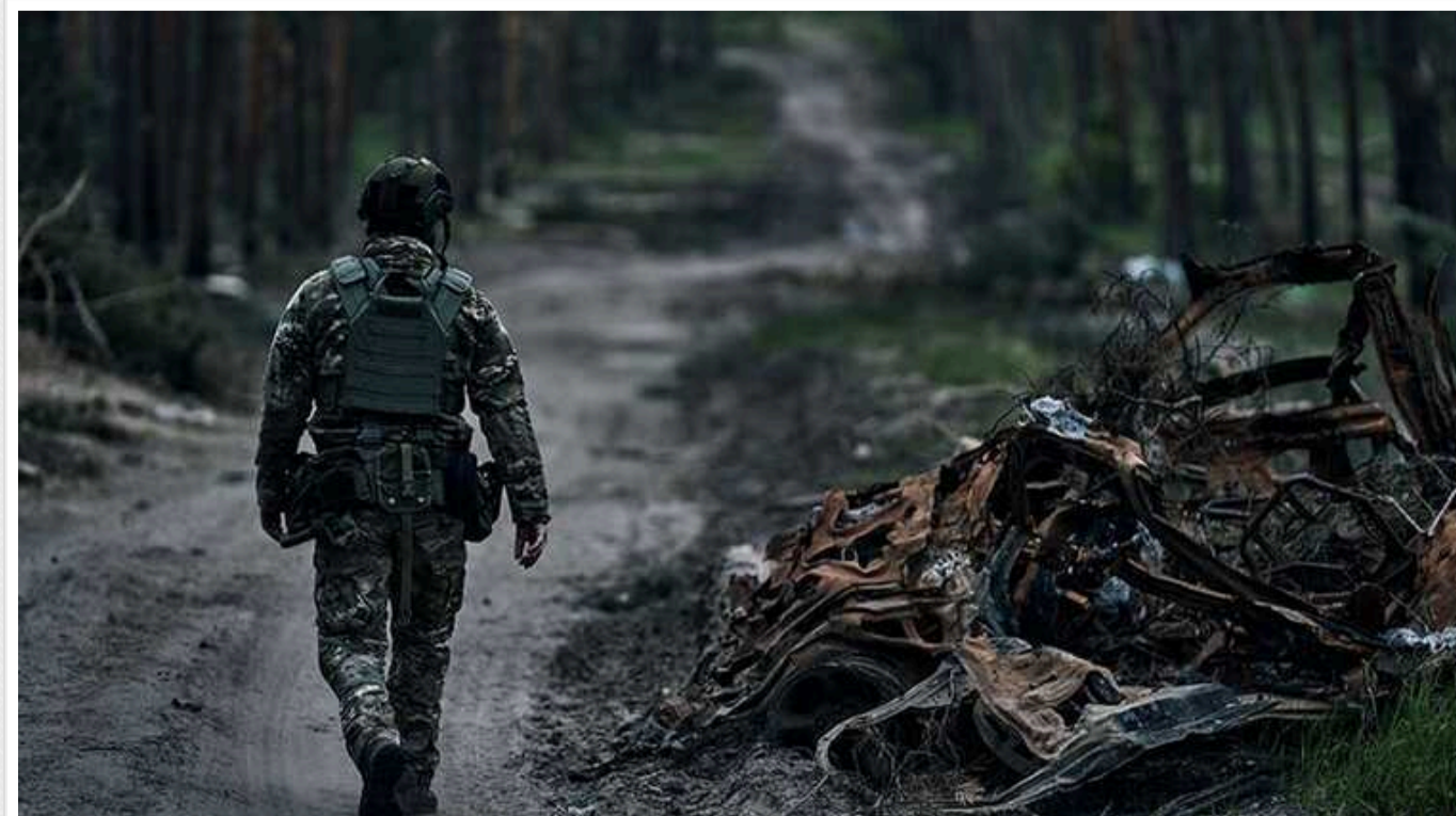
Бійці 3-ї ОШБр вдарили по російському "Спартаку" в Авдіївці

На околицях Авдіївки було виявлено ворожий броньований гантрак з 57-мм гарматою С-60. Українські військові відпрацювали по ньому за допомогою гаубиці "Мста-Б".