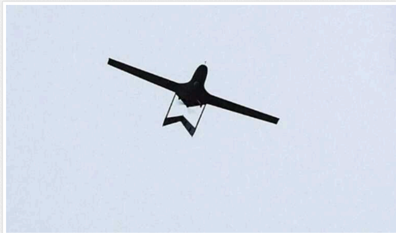
Українські дрони знищують рашистів в районі Горлівки

Українські військові з 24-ї окремої механізованої бригади імені короля Данила за допомогою ударних дронів знищують російських загарбників.