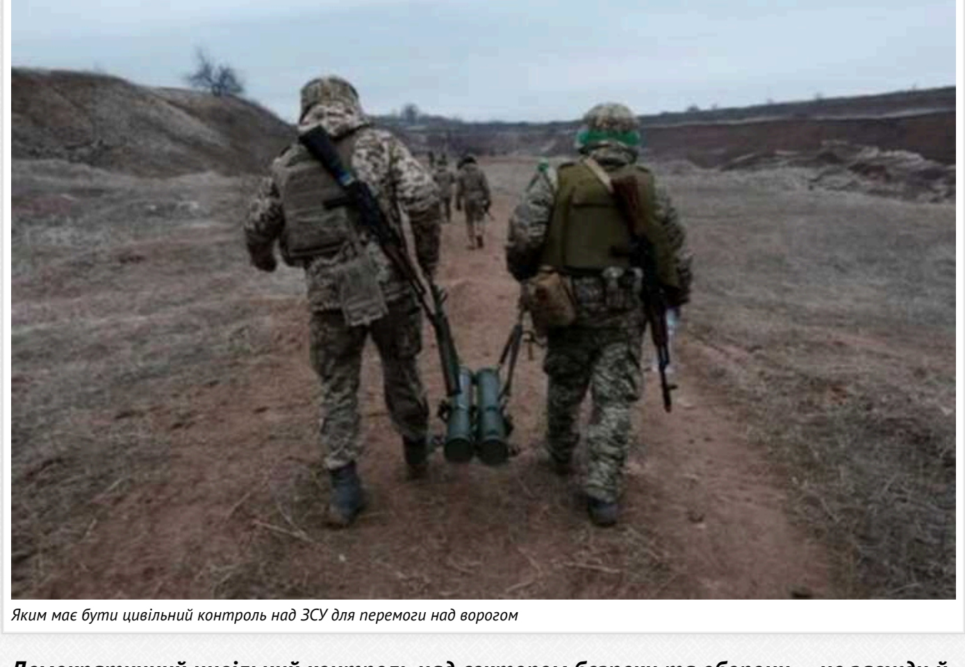
Яким має бути цивільний контроль над ЗСУ для перемоги над ворогом

Демократичний цивільний контроль над сектором безпеки та оборони — не завжди й не для всіх очевидна, проте необхідна річ.