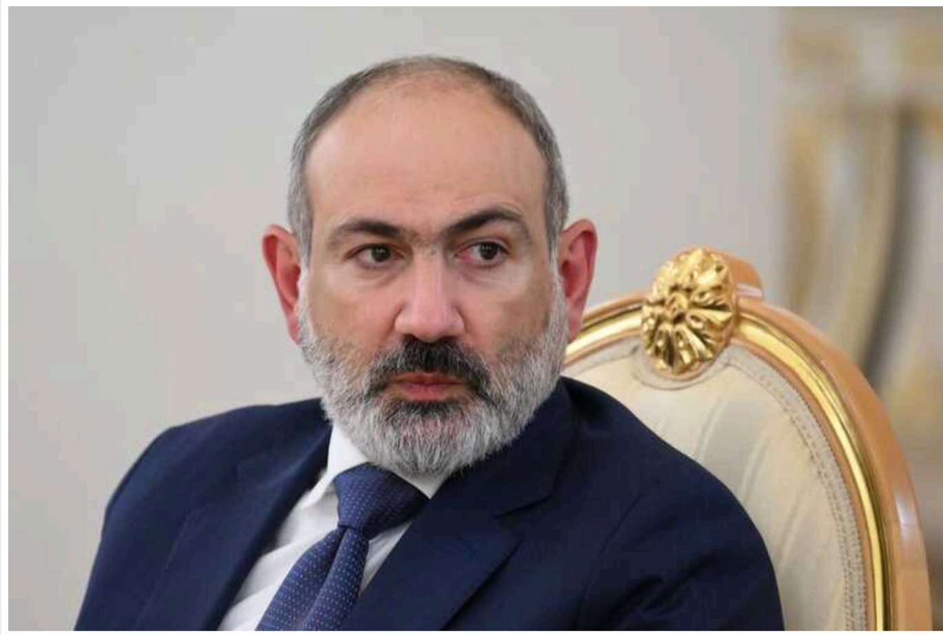
Війна між Азербайджаном та Вірменією може розпочатися «наприкінці тижня», – Пашинян

Це може статися, якщо Єреван не піде на компроміс із Баку щодо сіл, які вважаються анклавом – тобто, територіями, населеними азербайджанцями, але у складі Вірменії.