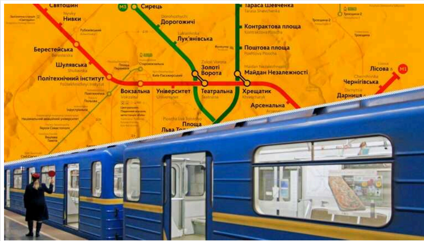
Київський метрополітен замовив ремонт червоної гілки за 1,5 млрд грн у родички бізнес-партнера експлави метро Брагінського

Про це повідомляється у розслідуванні Bihus.Info.