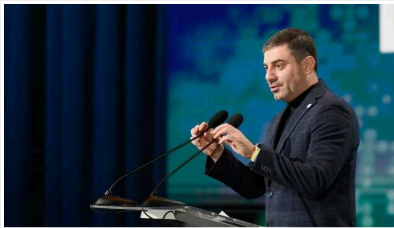
Майже 40% українців, які повернулися додому з Росії, вважалися зниклими безвісти, – Лубінець

Майже 40% тих українських громадян, кого вже повернули додому, вважалися безвісти зниклими.