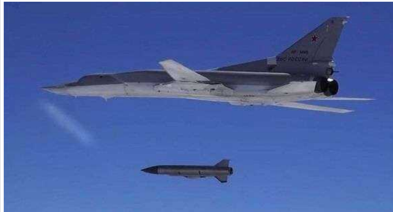
Окупанти завдали авіаудару по Козачій Лопані: пошкоджені будинки та ЛЕП

Росіяни завдали удару авіабомбами по прикордонній Козачій Лопані на Харківщині.