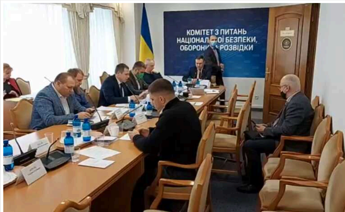
Комітет ВРУ з питань нацбезпеки та оборони отримав завдання розглянути всі правки до законопроекту про мобілізацію у найближчі 24 години, – джерело

Зумовлено це тим, що вже завтра, у середу, 20 березня, планується проведення засідання ВРУ, на якому хочуть розглянути та ухвалити в цілому проект закону.