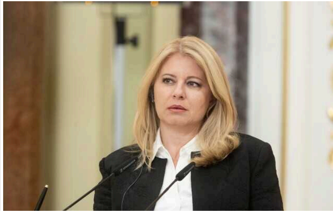
У Словаччині президент прокоментувала антиукраїнську позицію уряду Фіцо

Рішення інших країн підтримати Україну на тлі її протистояння російській агресії було правильним та справедливим. Чинний уряд Словаччини, ймовірно, має іншу точку зору.