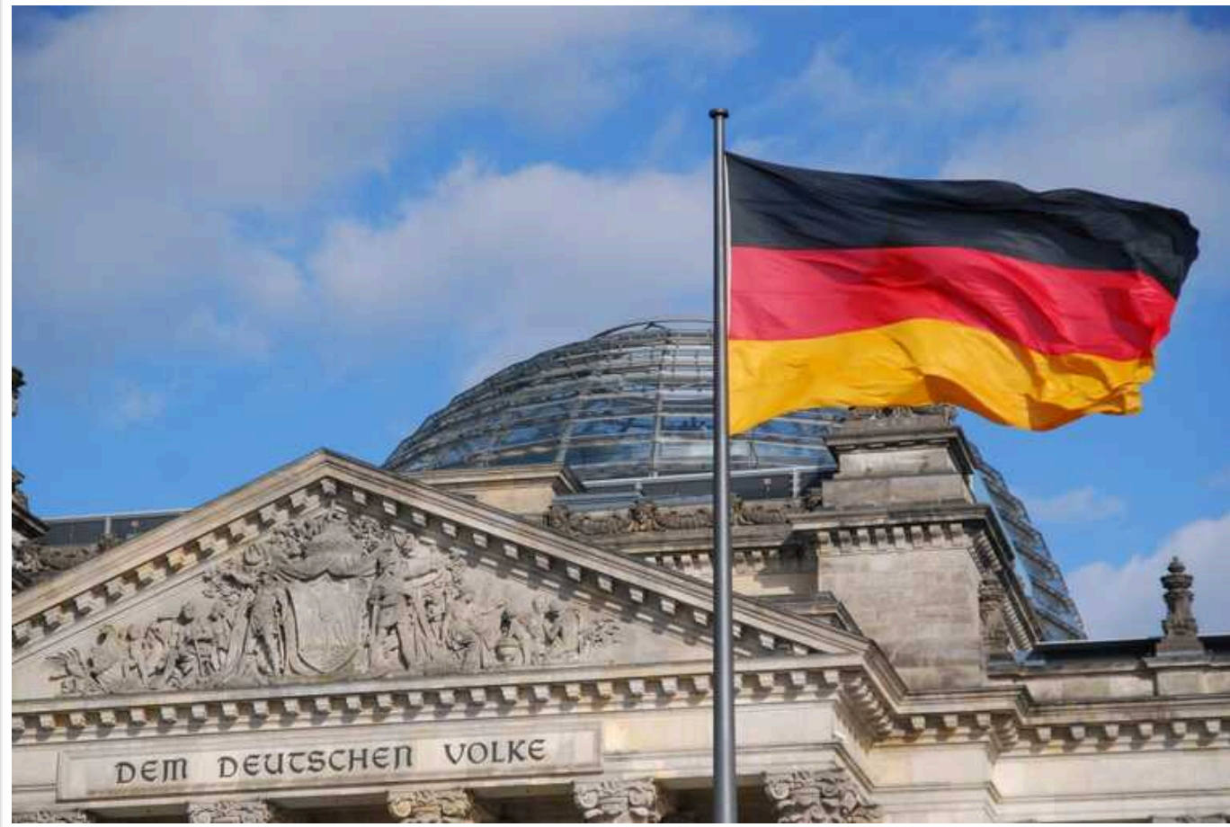
У Німеччині посилюється скандал довкола витоку деталей із зустрічі про Taigus для України, – ЗМІ

Президентка Бундестагу розкритикувала очільницю оборонного комітету через ситуацію з витоком деяких деталей зустрічі щодо Taigus для України, а вона відповіла, що вважає критику незаслуженою.