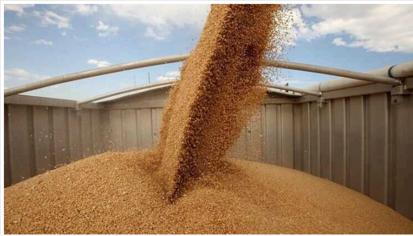
Financial Times: ЄС планує ввести мита на імпорт зерна з РФ та Білорусі

Видання Financial Times дізналося, що Європейський Союз планує ввести мита на імпорт російського та білоруського зерна, щоб заспокоїти аграріїв та деякі країни-члени. Це буде перше обмеження на продовольчі товари з Росії після початку повномасштабного вторгнення в Україну.