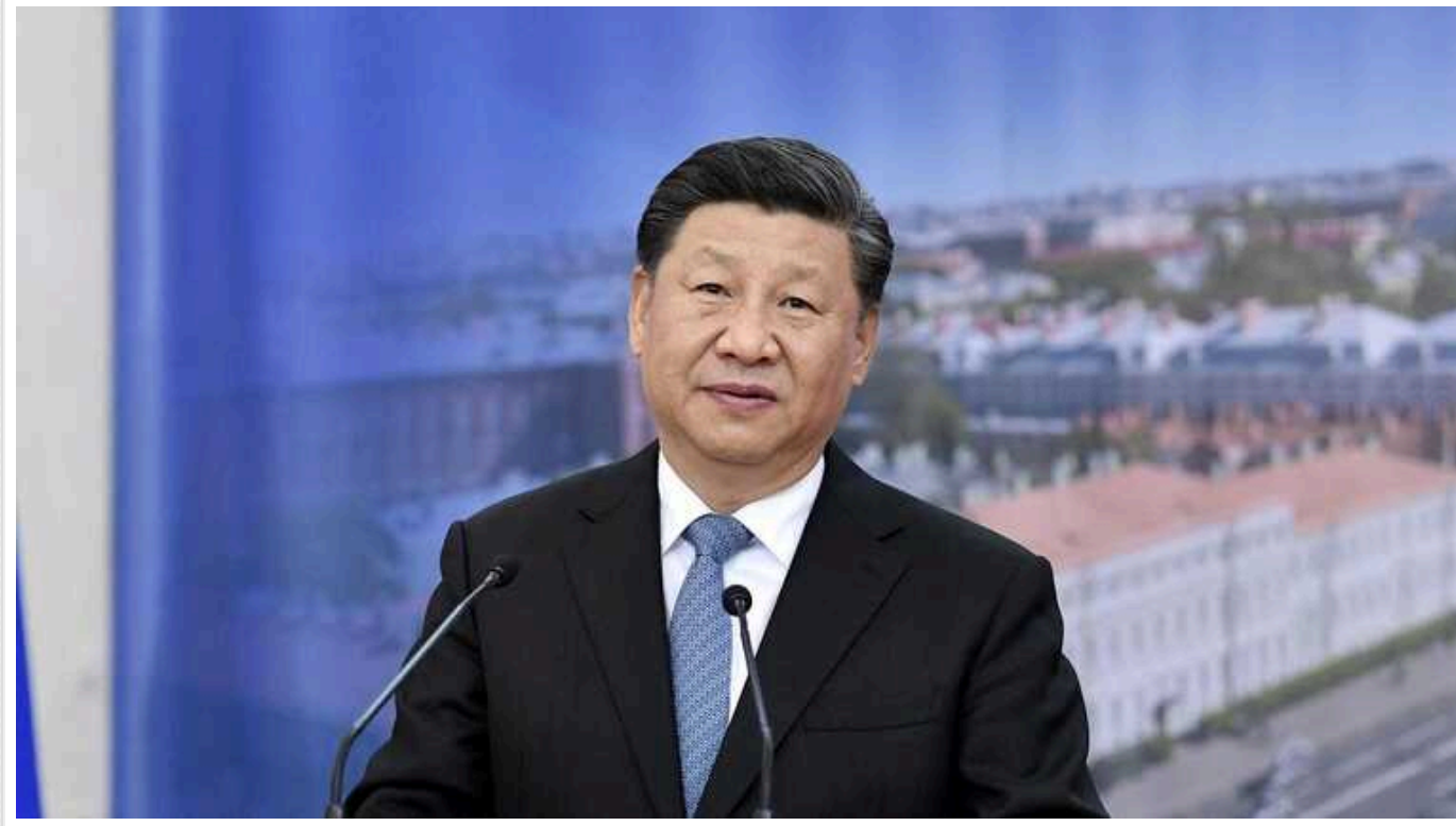
Сі Цзіньпін готує перший візит у Європу з часів пандемії, – Politico

Президент Китаю Сі Цзіньпін на початку травня відвідає Париж для зустрічі зі своїм французьким колегою Емманюелем Макроном. Це стане його першою поїздкою до Європи з часів пандемії.