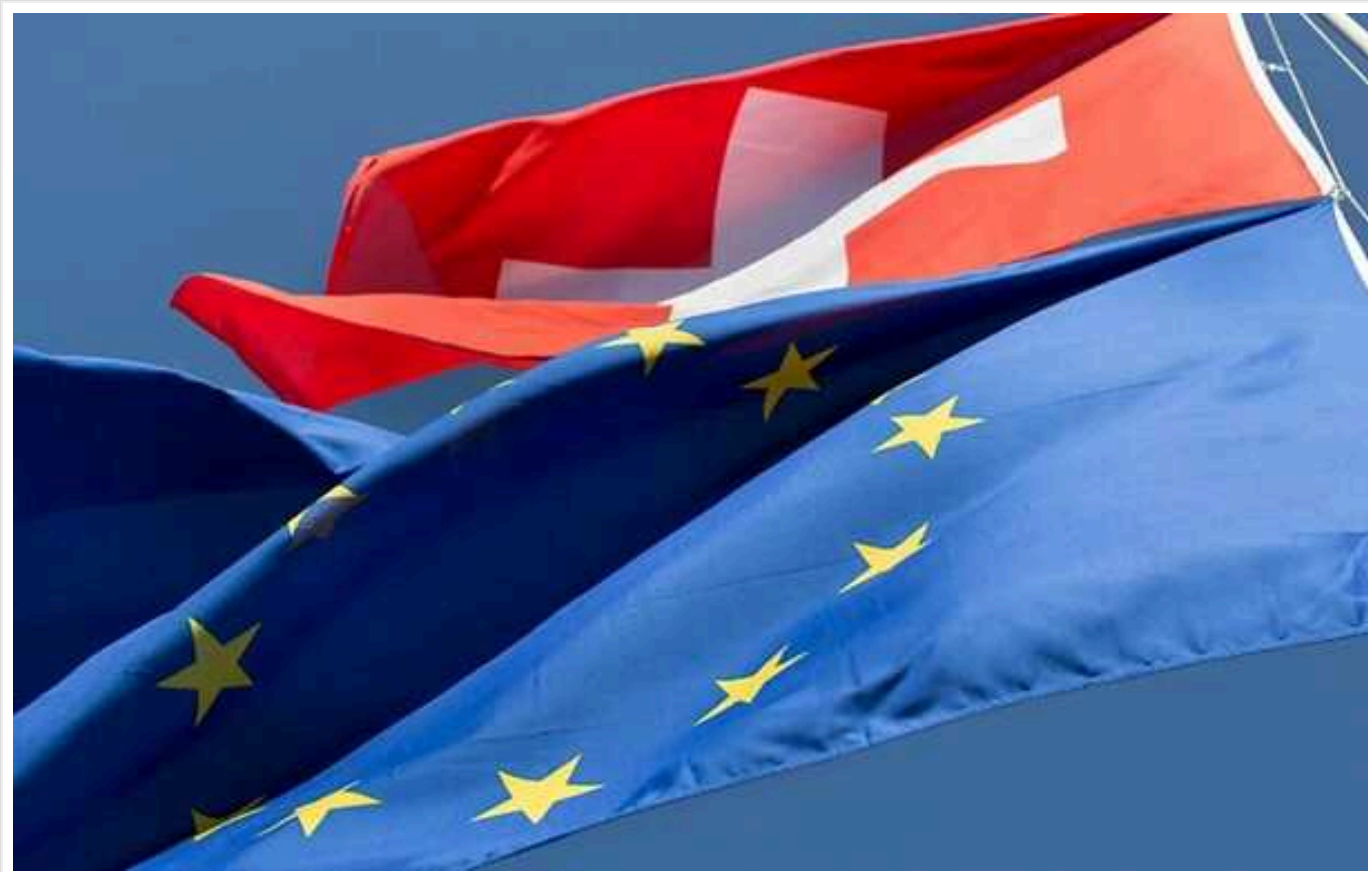
Швейцарія та Євросоюз розпочали процес для поглиблення відносин

Президентка Єврокомісії Урсула фон дер Ляен та президентка Швейцарії Віола Амгерд розпочали 18 березня переговори щодо широкого пакету заходів, спрямованих на поглиблення та розширення відносин між ЄС та Швейцарією.